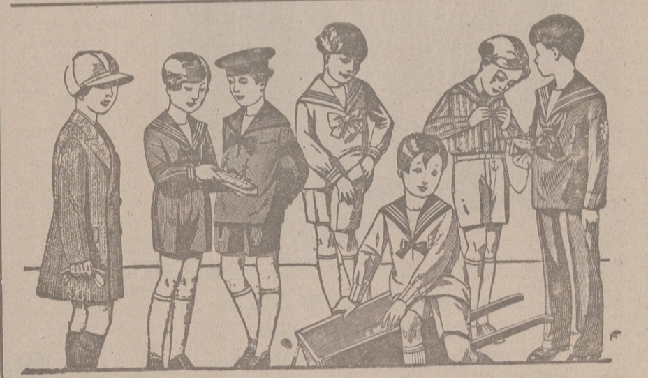
50 modelos distintos en trajecitos para niños en dril, en pana, en paño y en jergas azules, de 10 a 40 pesetas.