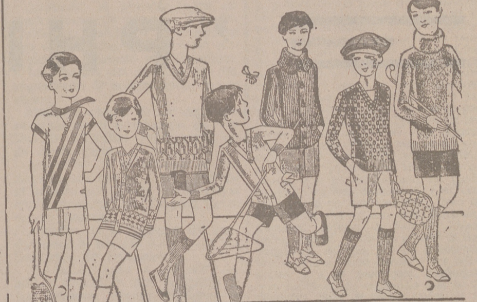
Jerseys para niños, dibujos novedad, desde 4, 4,50 5, 6, 7, 8, 10 y 12, ptas. Siempre gran surtido para elegir