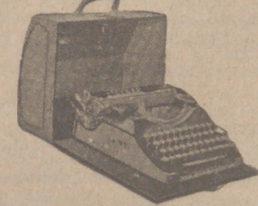
Máquinas de escribir