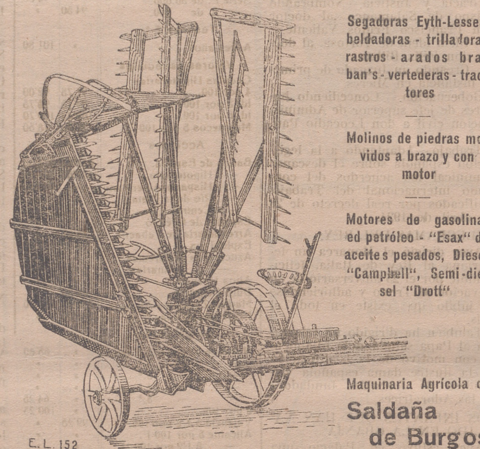
Maquinaria Agrícola de Saldaña de Burgos

El grado de progreso de la agricultura en un país, puede medirse por el consumo que se haga de NITRATO DE SOSA.