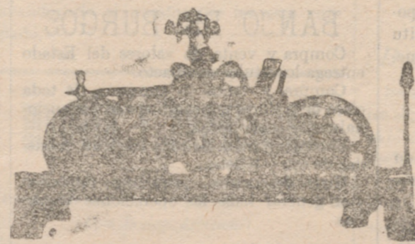
Reloj de ocho días de cuerda tocando heras con repetición y medias