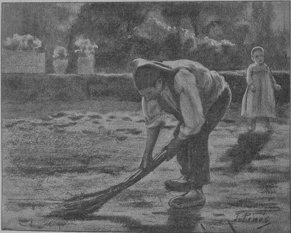
La netedat es mitja vida.