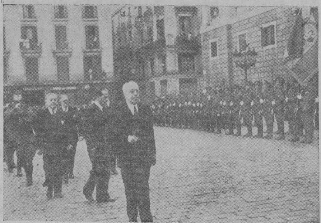
El Presidente de la República pasando revista en la Plaza de la República a la Es-colta presidencial, acompañado de los señores Negrín, Martínez Barrio y Alvarez del Vayo

Homenaje a todos. Destaco, escogiendo palabras del capitán antitanquista que ha habido, y en ocasión de la fecha del 19 de julio, la conducta de los guardias de Seguridad, en la fecha que conmemoramos, y a la que no se ha hecho la debida justicia. El ejército no se ha hecho a la manera de Bar-subelevado fué deshecho en una manera efectiva. El pueblo cooperó de una manera efectiva y con su aliento cívico. Los guardias de Seguridad, a las órdenes de mi Gobierno, lanzados al encuentro de las fuerzas militares