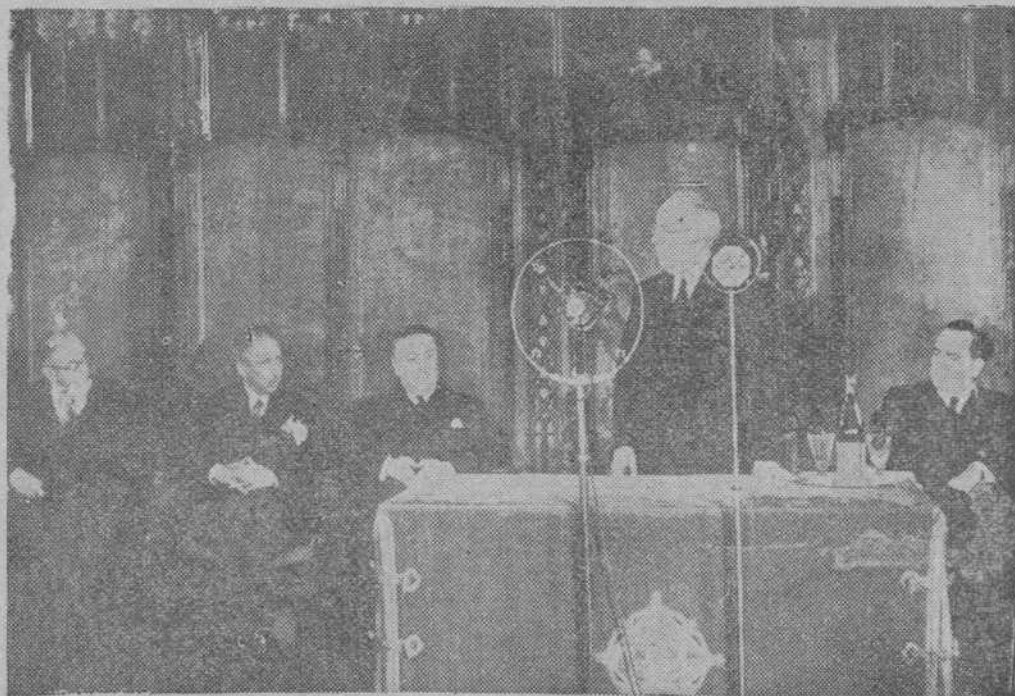
“El Presidente de la República durante su discurso. — A su derecha el presidente de las Cortes de la República, don Diego Martínez Barrio; el Presidente de Cataluña, don Luis Companys, y el ministro de Estado, don Julio Alvarez del Vayo y a su izquierda, el presidente del Consejo, don Juan Negrín.

Lo que importa es tener razón y saber defenderla.—La República nunca ha deseado una guerra general para disolver en ella nuestro problema nacional.—Una paz de hombres libres para hombres libres