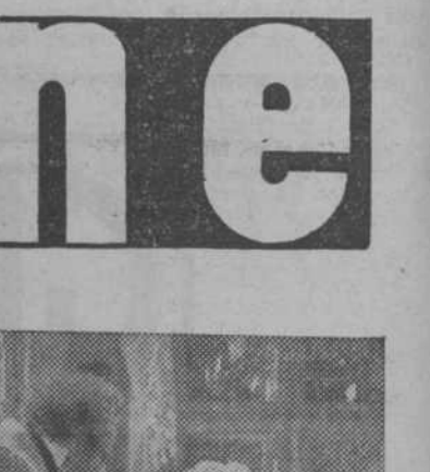
Una escena de "Su mayor éxito", superproducción Ufilmas, que pronto se estrenará en Madrid