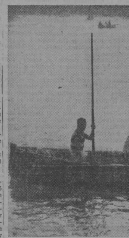
«El Lago Grande», campo de hazañas navales, visto a contraluz en un bello atardecer madrileño

Ya el equipo de remeros ha vencido al del ministerio de la Marina, donde había «mullidos» muchachos—de Orió, Pasajes, San Sebastián y Fuen-