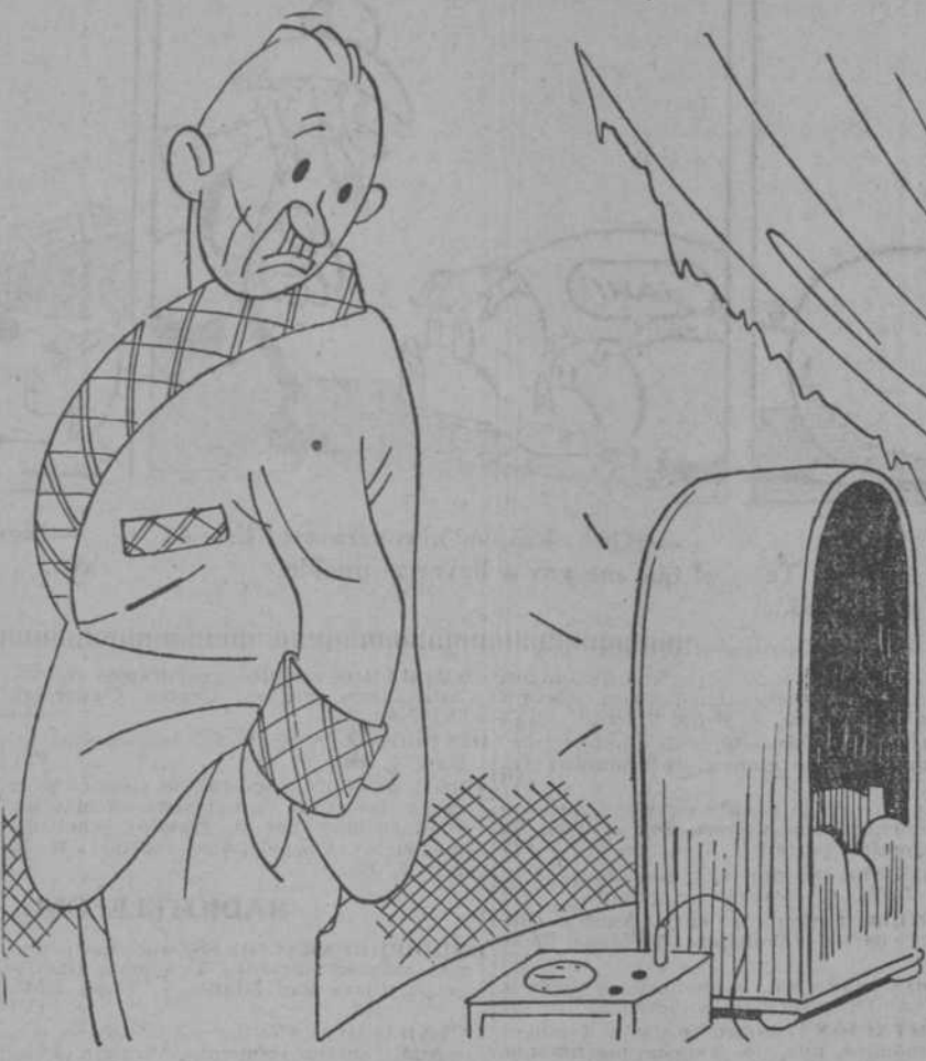
"Radio Paris": "Aires populaires".