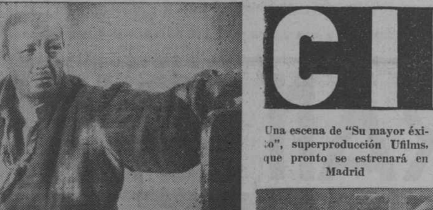
Harry Baur en su formidable creación del Jean Valjean de "Los miserables"

El próximo lunes se reestrenará en el Cine San Miguel la grandiosa superproducción Ufilmas, "El último vals de Chopin", estrenada con clamoroso éxito en el Cine del Callao.