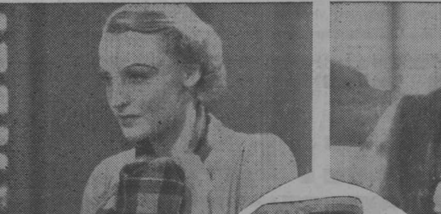
Brigitte Helm, la bellísima estrella alemana, en el gran "film" UFA "Oro", que dentro de pocos días se estrenará en el aristocrático Callao

maticos, está dirigida con tal acierto e interpretada con tal verismo, que hace vibrar igual manera a todos los públicos: a los amantes de las finas comedias y a los partidarios del melodrama, a los que gustan de la técnica depurada y a la gran masa que, sin pre-