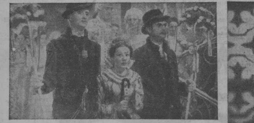
Una escena del gran "film" de Franziska Gaal "Desfile de Primavera", que con enorme éxito se proyecta en el Avenida

SI VA USTED A ZARAGOZA, NO DEBE DE VISITAR EL Café-Restaurant SALDUBA PLAZA CONSTITUCION, 6 y 7