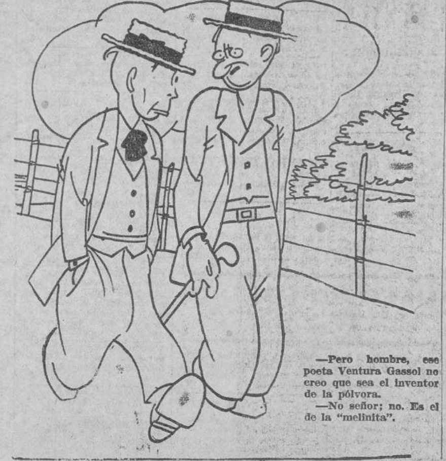
—Pero hombre, ese poeta Ventura Gassol no creo que sea el inventor de la pólvora. —No señor; no. Es el de la "mellinita".