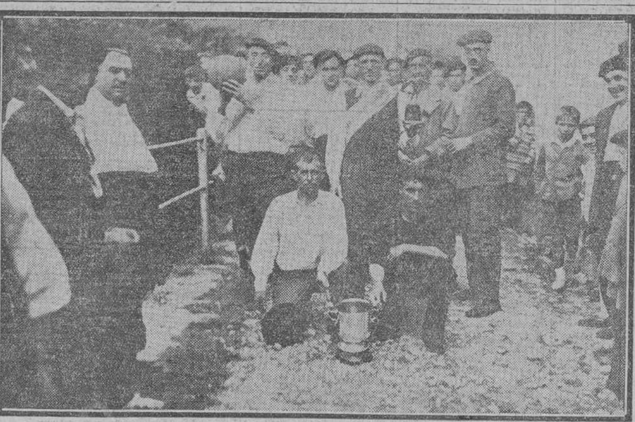
Mellón llega a Inglaterra

PLYMOUTH, 16.—El señor Mellón, secretario del Tesoro de los Estados Unidos ha llegado a ésta y saldrá para Southampton. Antes de dirigirse al Continente pasará por Londres.