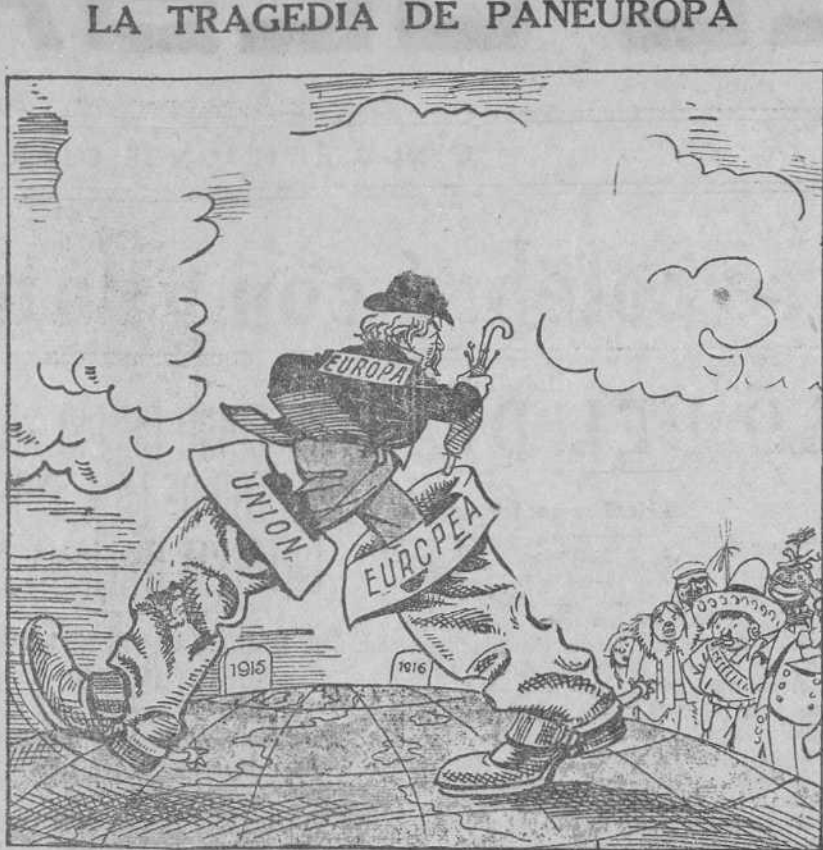
SE CREA O NO SE CREA ('The Daily Express', Londres.)