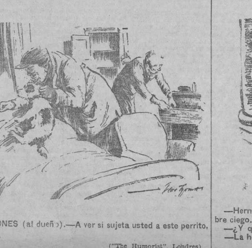
UNO DE LOS LADRONES (al dueño).—A ver si sujeta usted a este perrito, que no nos deja trabajar.