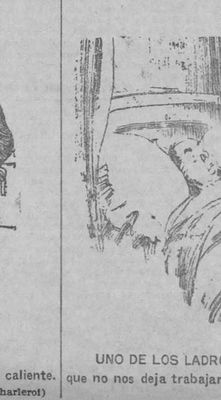
UNO DE LOS LADRONES (al dueño).—A ver si sujeta usted a este perrito, que no nos deja trabajar.