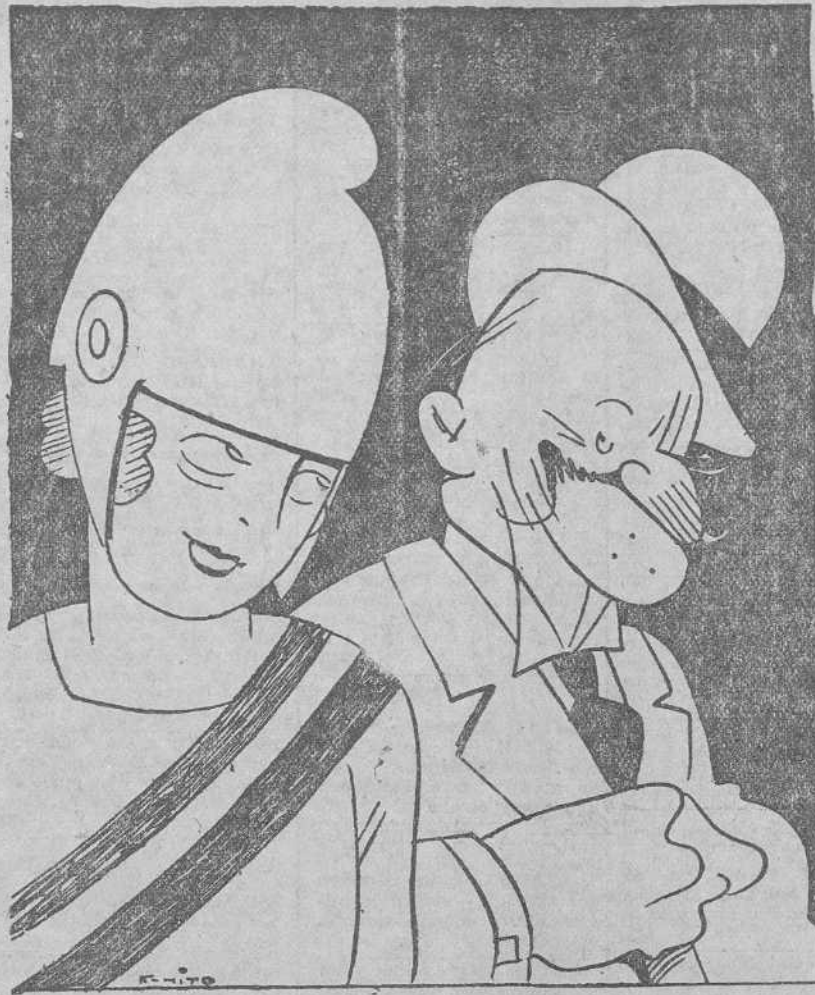
—¿Qué hombre tan simpático!