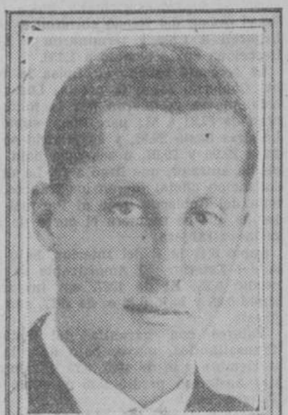
Supremo de Guerra