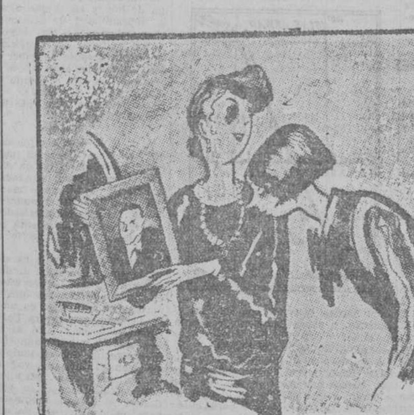
Es mi novio. Me gusta porque tiene mucha personalidad. De frente es igual a Richard Barthelme y de perfil se parece a Adolfo Menjou.