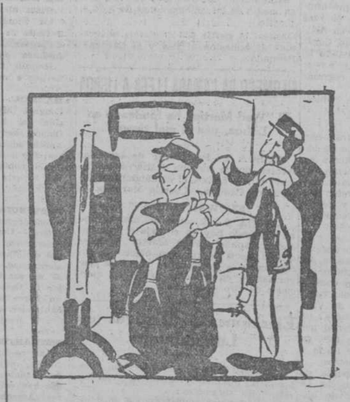
—No; si el traje me está muy bien. Quizá el pantalón me aprieta un poquito en los sobacos. (Revista de Revistas, Méjico.)