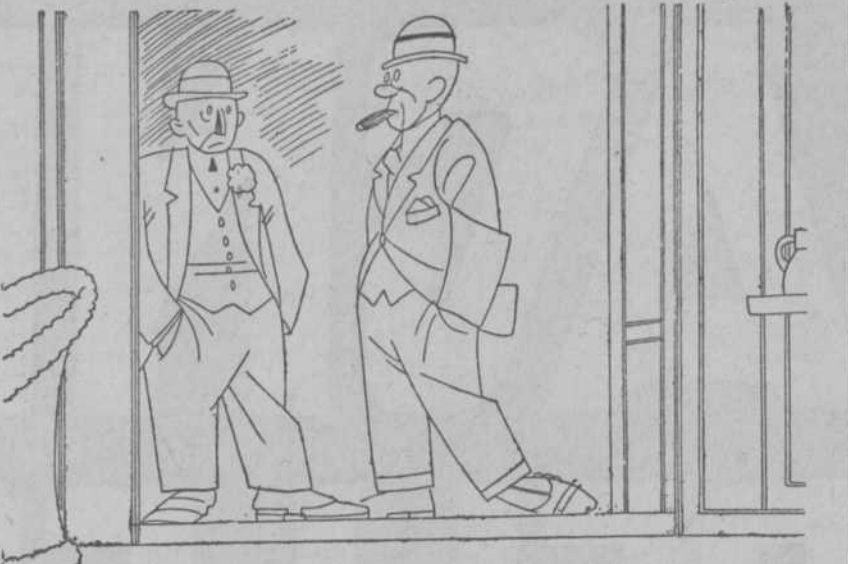
—Pues nosotros acabamos de representar "La Gran Via" en provincias y no nos dejaron cantar lo de: "Soy el rata primero, y yo el segundo, y yo el tercero". —Claro; la campaña de desratización.