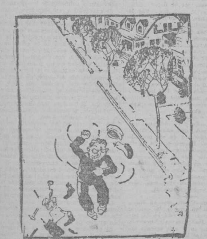
EL LADRON.—¡Maldita suerte! He recorrido diez casas y no encuentro la pantalla de color malva que me encargó mi mujer. (Judge, Nueva York.)