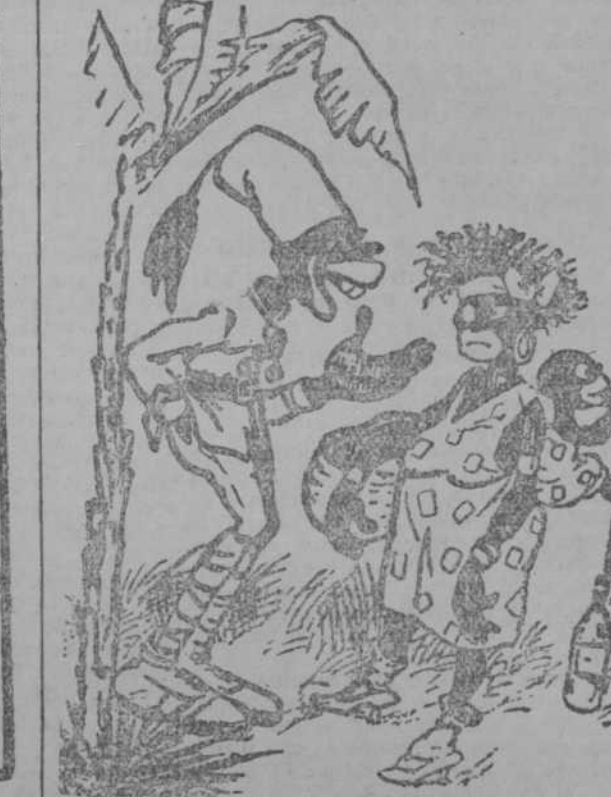
—Me he divertido muchísimo en Europa, vieja. —Sí; pero has perdido los colores. (La Vie de Garnison, Paris.)