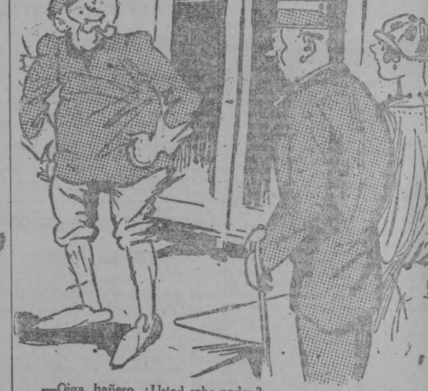
—Oiga, bañero. ¿Usted sabe nadar? —¡Anda! Hago la plancha dos horas, me sumerjo quince minutos, hago el muerto... —Bueno, bueno. Yo le pregunto a usted si sabe nadar. (Pelle-Mele, Paris.)

mirables que han llamado la atención de nacionales y extranjeros. Traje a mi memoria estos actos los tiempos—hace ya cuarenta años—en que yo era director de la sección de Madrid. (Aplausos.) Los progresos de la obra me llenan de consuelo; ya es sabido que la devoción a la Eucaristía es muy expansiva.