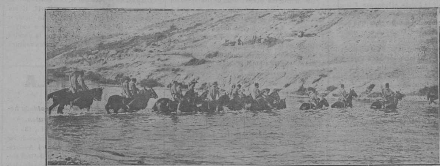
CABALLERIA TURCA VADEANDO UN RIO

«Injurien é insulten ellos, que nosotros nos