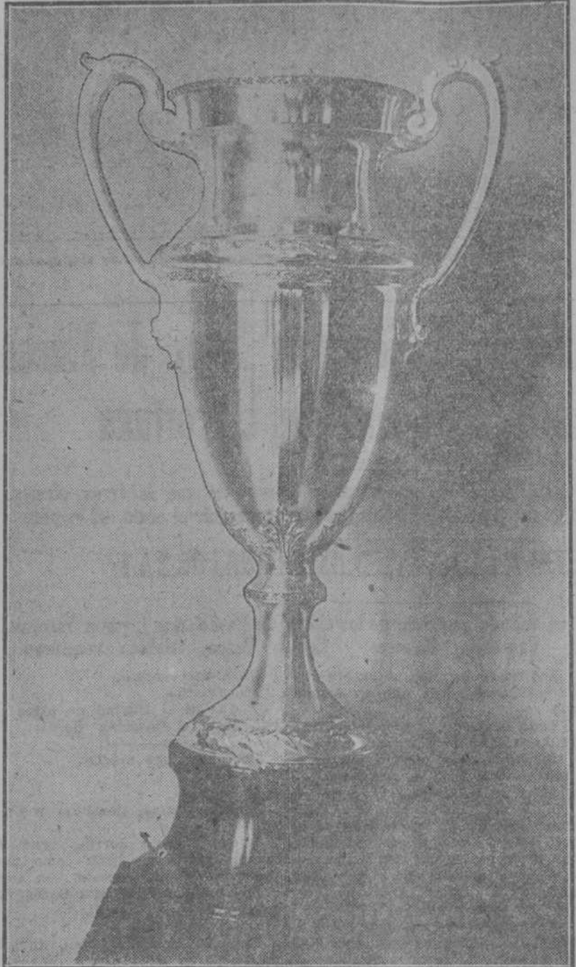
Artístico trofeo donado por la popular tienda de ropa "El Encanto", que fué ganada ayer en el Handicap de la quinta carrera por True American

Fué ese el plato fuerte de la tarde hípica en el Parque Oriental. Cream Puff que era el favorito, ganó el "show" ya que el "place" se lo había arrebatado al distinguido malojero que montó Ceving