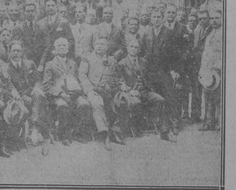
Grupo de los compromisarios que asistieron a la Asamblea Provincial.