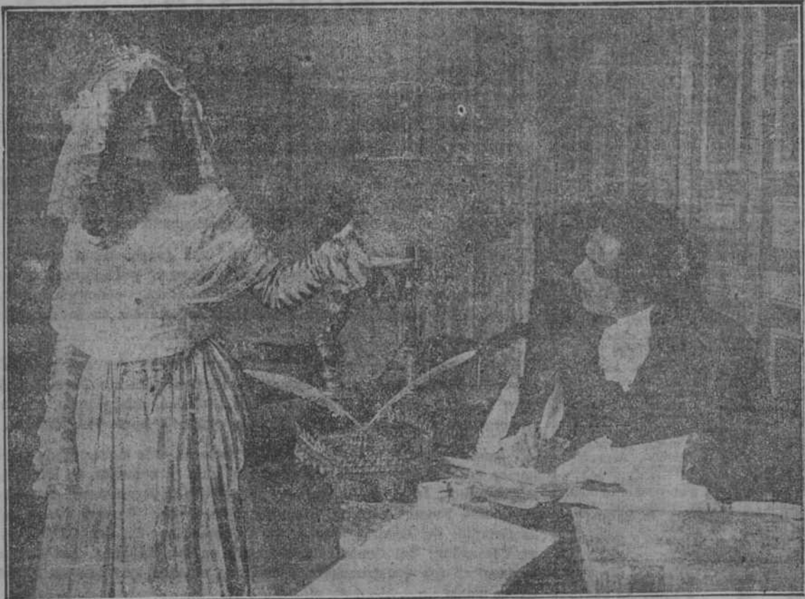
Si es cierto que me amás—le dice—desembrazadme de mi marido, dándole pasaporte para un país