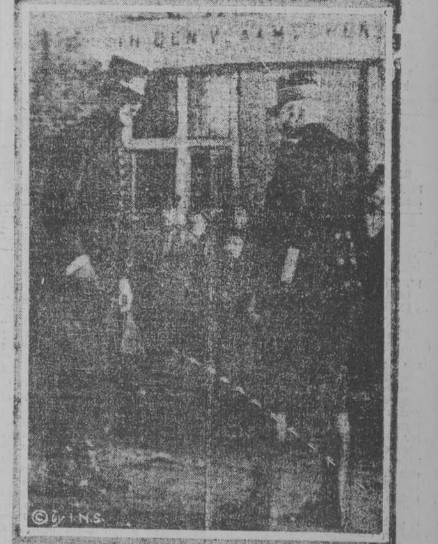
EL GENERAL JOFFRE CON EL REY ALBERTO. En esta interesante fotografía se ve al general Joffre y el Rey Al- berto de Bélgica en una conferencia que sostuvieron en la fron- tera; como se ve en la fotografía se encuentran detrás de la línea de combate. El general Joffre ha pagado su tributo al trabajo del rey Alberto de Bélgica, y su pequeño ejército de valientes soldados.

A uno de los dos zeppelines donados a Austria por Alemania ha caído en el Atlántico, perdiendo sus tripulantes. CAMPAMENTO TURCO BOMBAR- DEADO Londres, 17. Diece que diez acorazados se han aproximado al puerto de Enos, que está situado a unas 35 millas de Yal- lipoli, y que dos de ellos, penetran.