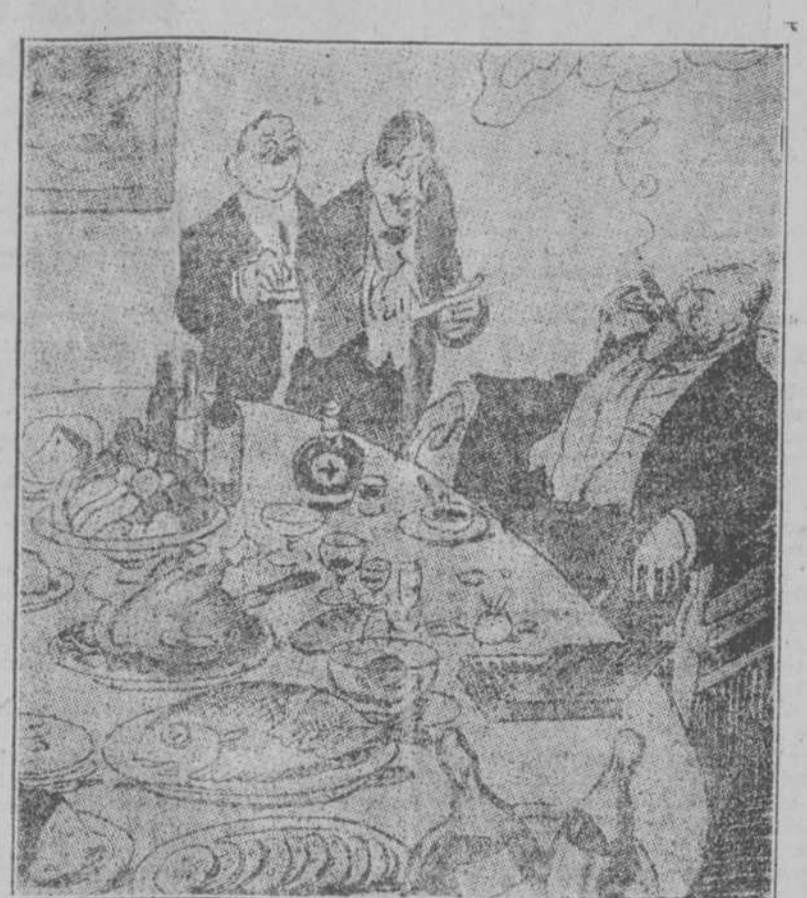
Y qué nos dice usted, señor ministro, de la carestía de subsistencias? Que siempre se exagera! (España Nueva, de Madrid.)