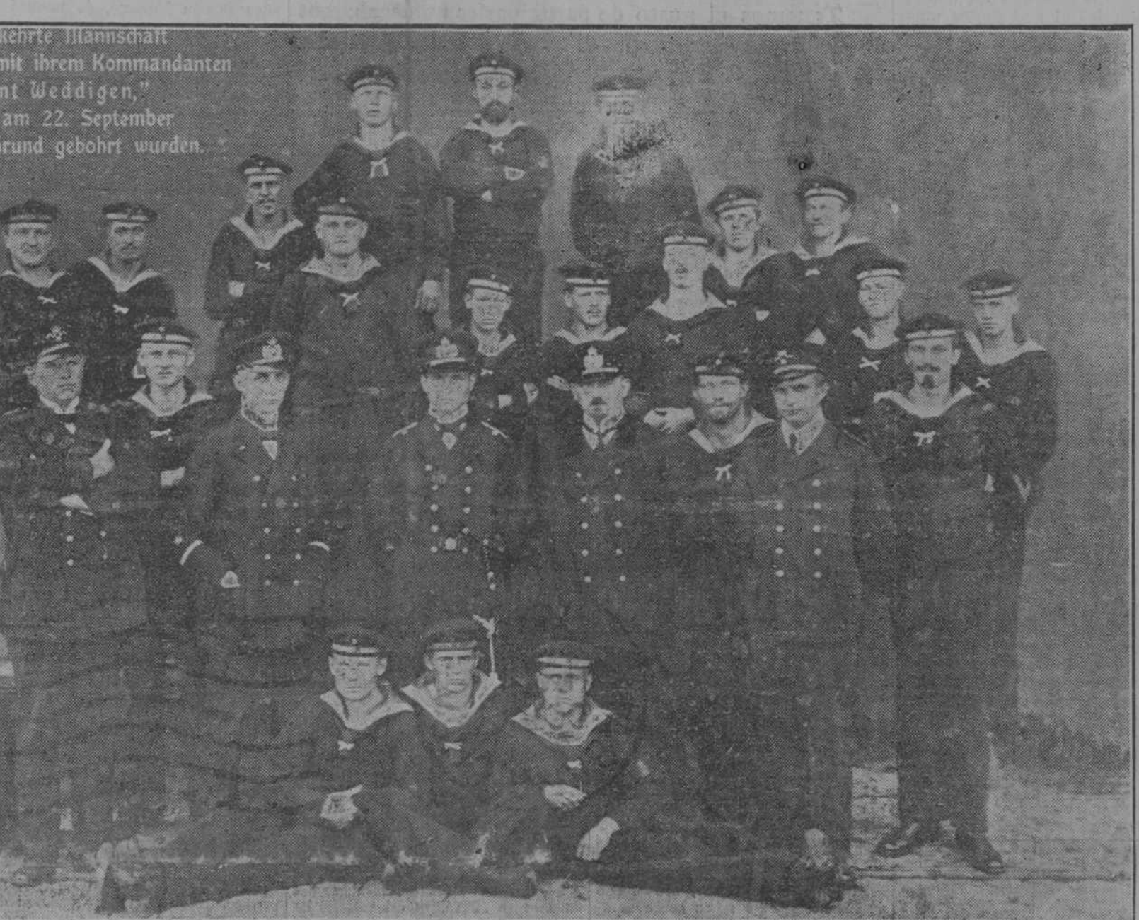
Die glücklich zurückgekehrte Mannschaft des U-Bootes „U 9“ mit ihrem Kommandanten „Kapitänleutnant Weddigen“, durch deren Heldentat am 22. September 3 engl. Kreuzer in den Grund gebohrt wurden.