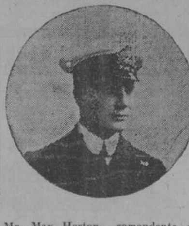
Mr. Max Horton, comandante del submarino inglés "E. 9" que echó a pique a un destroyer alemán, frente a las costas alemanas, el 7 de octubre.

El ejército austriaco, tan calamitado desde el comienzo de la campaña, realizó una ardua empresa tan poco estimada como mal comprendida. Para dar lugar a que los alemanes reconcentrasen sus fuerzas sobre el teatro occidental de la guerra, atrajo sobre sí todo el empuje del grueso del ejército ruso, y los generales Daukl y Auffenberg, llevados de este propósito, asumieron la ofensiva en la dirección de Lublin, consiguiendo el primero grandes triunfos en las batallas de Krasnik y Lublin