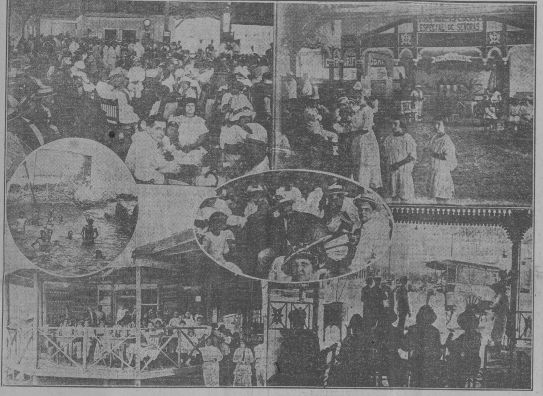
ASPECTO QUE OFRECEN ALGUNOS BALNEARIOS.—BANISTAS Y CURIOSOS