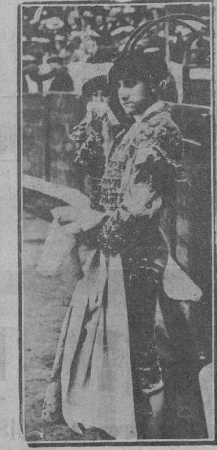
rabos. Este año pienso torrear 25 o 30, y entre ellas han de figurar las de Madrid, donde debutaré el día 4 del mes que viene. —No tiene usted miedo a eso día? —Ni a ninguno. Yo no conozco el miedo,