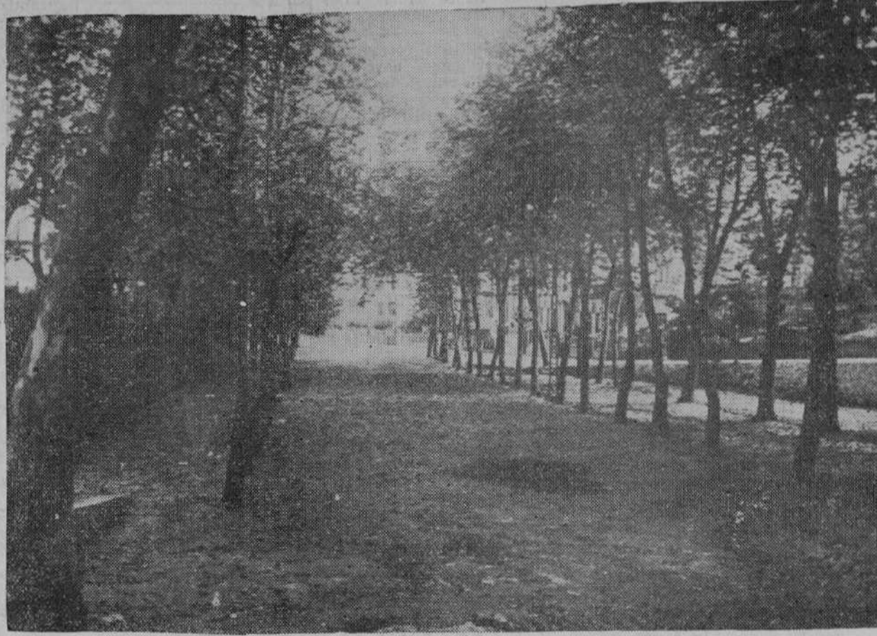
He aquí a la vieja y popular Alameda de Cacho que, según recogieron ayer los periódicos de boca del alcalde, va a ser objeto de una completa transformación.