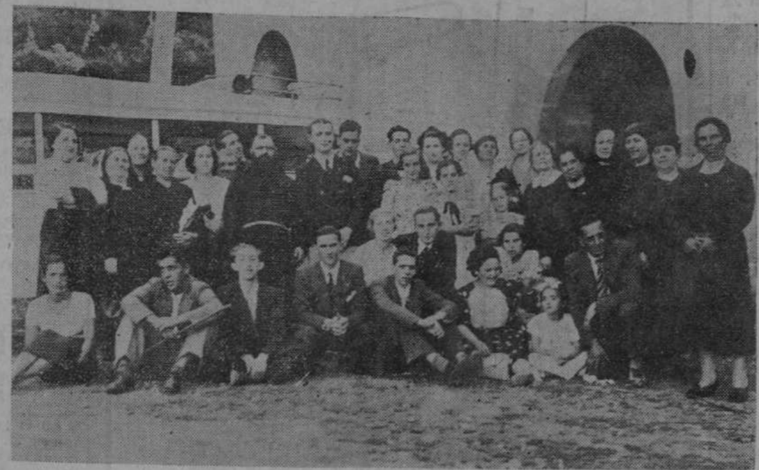
EN SANTO TORIBIO DE LIÉBANA. Excursionistas de la Ven. Orden Tercera, de Santander, que visitaron el domingo el histórico Monasterio.

TORRES MUEBLES - PROYECTOS DECORACION Fortuny, 6-MADRID-T. 30532