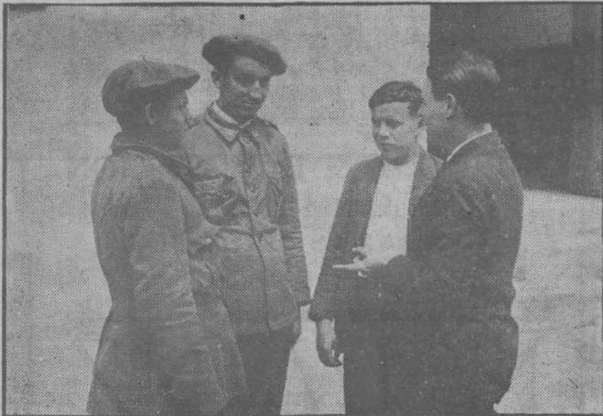
El «reporter» con el alumno más aventajado, y dos éuskaros que no conocen el castellano.

—Sí. Los analfabetos no tienen derecho a las licencias cuatrimestrales. Esa limitación les estimula, primero por egoísmo y después por entusiasmo, a conocer el abecedario y a deletrear rápidamente. Cuando llega la época de