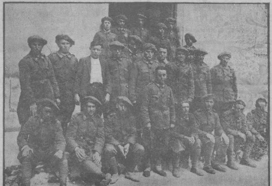
Los alumnos, terminada la clase, salen al sol abrilero del mediodía.

TALLERES TIPOGRAFICOS DE LA «EDITORIAL MONTANESA» CALLE DE SAN JOSE, NUM. 19