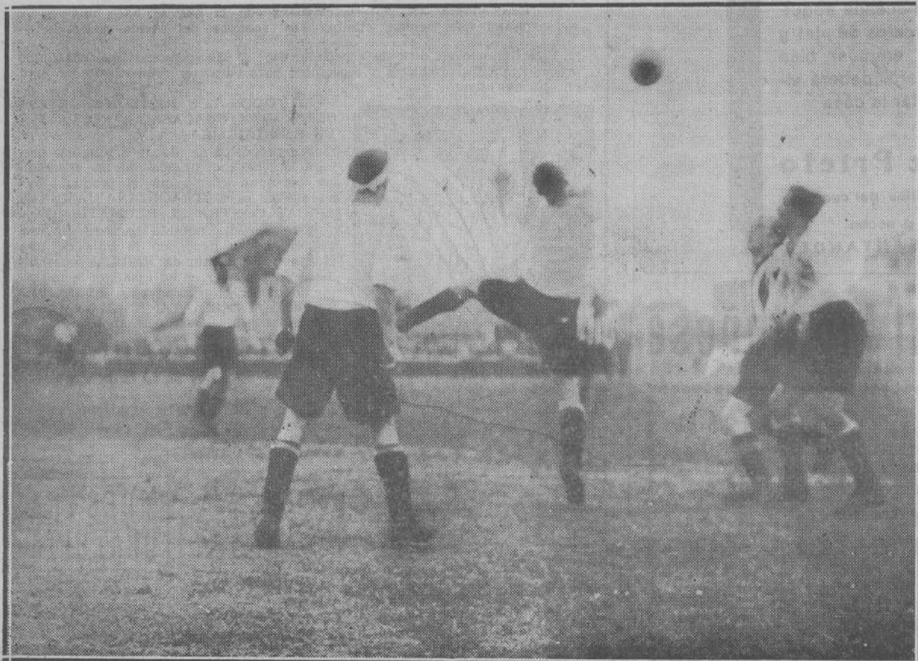
DEL "MATCH" REAL UNION DE IRUN-RACING, EN GAL.—Una interesante fase del encuentro del domingo en la que se ve la defensa que hace de su puerta el equipo racinguista.

El notable recitador, que obtuvo un nuevo éxito para unir a los muchos que ha conquistado, fué aplaudidísimo y cariñosamente felicitado por lo irreprochable de su labor.