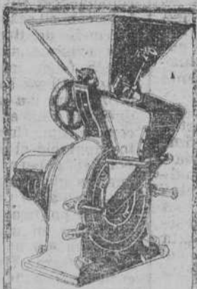
MOLINOS de todas clases, para mader y fuerza motriz. Traper doras. Desintegradoras. Cortadoras. Tasmadoras. Inmense surtido. Pídanse catálogo. MATHS. GRUBER Apartado 183, BILBAO

COMERCIO PRACTICO (preparación pocos meses). Contabilidad. Cálculos mercantiles. Inglés. Francés. Correspondencia. Mecanografía. Ortografía. Caligrafía. Precios módicos. Tableros, 4, tercero.