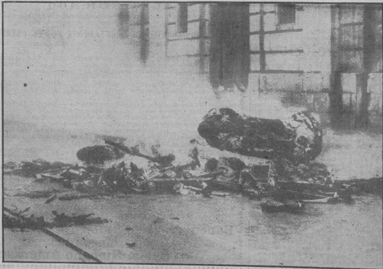
DE LA PASADA HUELGA GENERAL.—Estado en que quedaron las imágenes, bancos y confesionarios que los elementos revoltosos de Gijón quemaron en una hoguera que prendieron en el interior del templo de la Residencia Jesuítas de aquella ciudad.

Advertimos a los señores que nos favorecen con el envío de originales que no hemos solicitado que nos es imposible mantener correspondencia acerca de ellos.