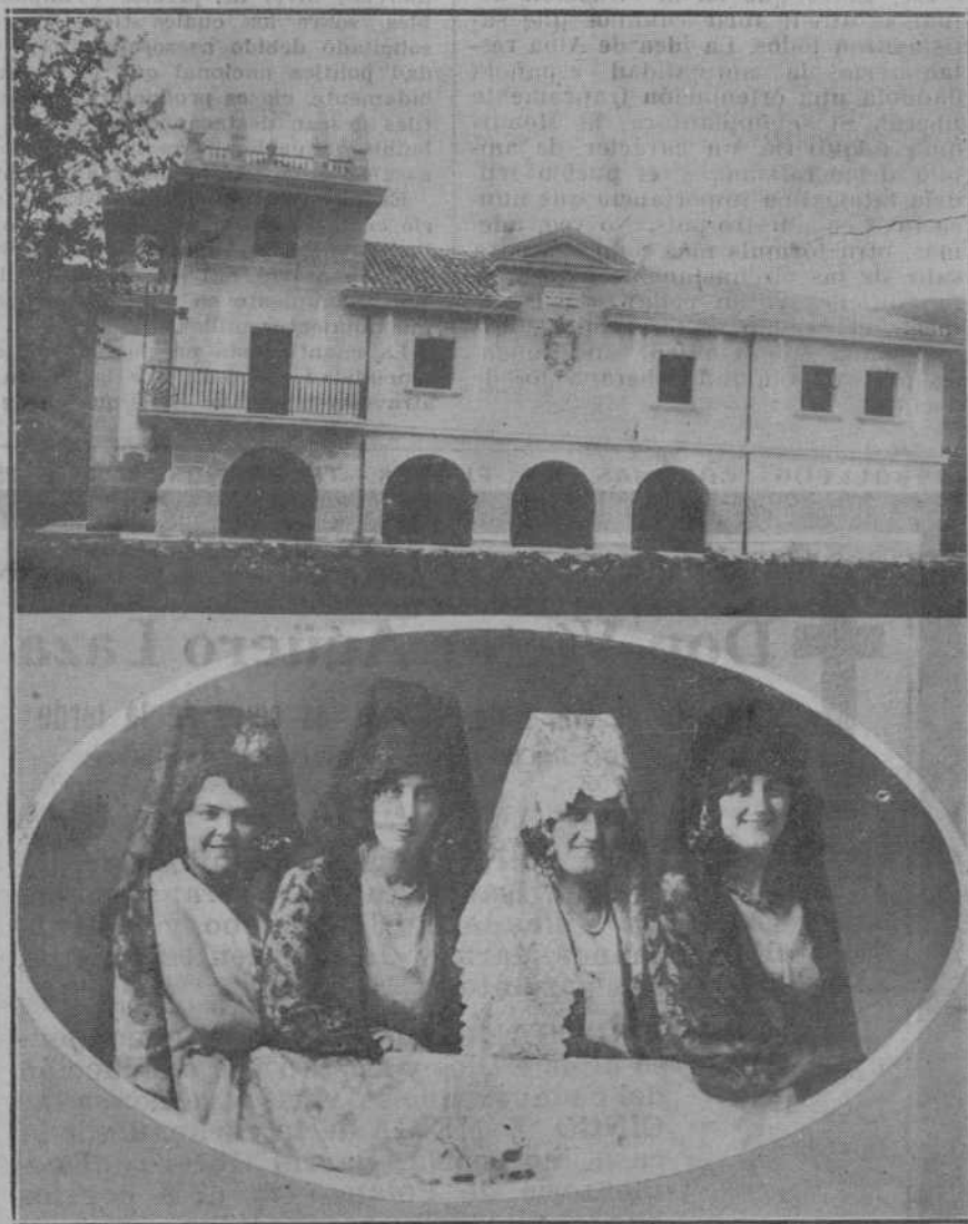
LA ACTUALIDAD EN LA PROVINCIA.—Nuevo edificio para Casa Consistorial del Ayuntamiento de Corvera, en San Vicente de Toranzo, que en breve será inaugurada.—Las lindas señoritas que presidieron la corrida de novillos celebrada en Castro Urdiales con motivo de las fiestas de San Pedro.—(Fotos Riancho y A. de la Torre)

Las Empresas de autocars Los Bárcenas y Bringas transportarán también gratuitamente a «La Vizcaína» a cuantos asistan al homenaje, a cuyo fin se anunciará oportunamente la hora de salida, que se verificará de la Avenida de Alfonso XIII.