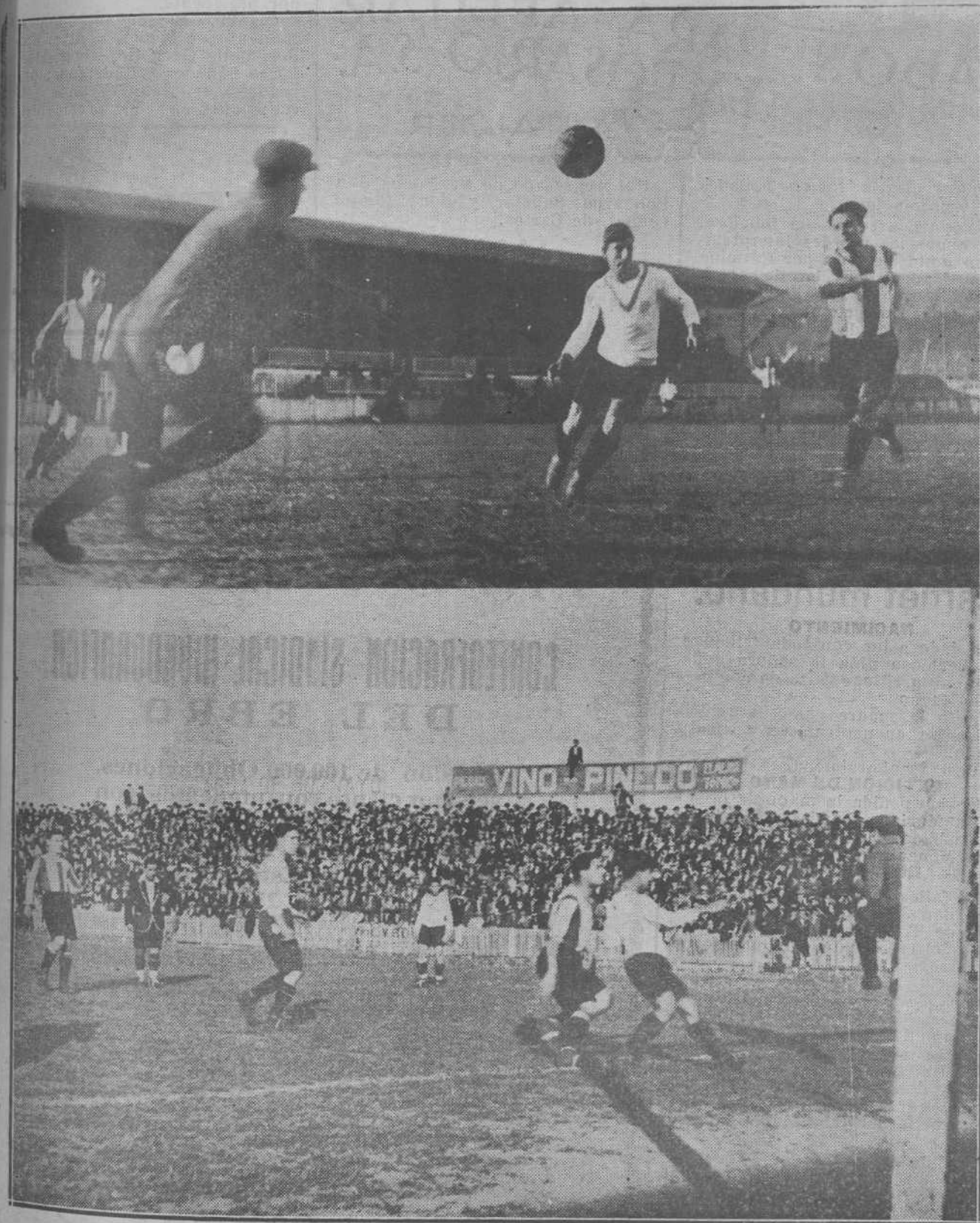
EL DOMINGO, EN LOS CAMPOS DE SPORT.—Dos interesantes momentos del partido Racing-Europa, en el que triunfó el primero por un copioso tanteo.