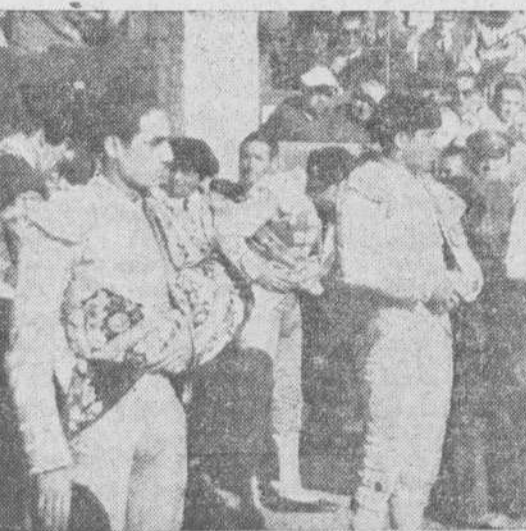
Los matadores, preparados para el paseo llizo

No podía haber casualidad — y hablémos ya, aunque brevemente, de los espadas — en aquel instante genial de Luis Miguel, en una de las tardes más completas de su vida torera, descubriéndonos un nuevo tono y un nuevo ritmo del toreo, llevando el pase natural aún más allá — pero donde ya no hay “más allá”, como si clavase un nuevo “NON PLUS ULTRA” — de lo que el toreo permitía, hasta hoy, dentro de su clasismo. No podía haber casualidad en aquella lidia, en aquella purísima interpretación del toreo rondoño de Antonio Ordóñez, afirmando el muleto sobre la plena adelantada, que es la única manera de cargar la suerte. ¿Se habrán convencido ya quienes creen que el toreo había encontrado sus nuevas normas en el natural de litigado codillero, en las manoleínas estáticas, en el arrodillamiento inerte y en el gesto trágico? Cuando yo escribía ayer también que “andaba el toreo muy por los suelos, muy arrodillado, muy débil de piernas”, ya sabían mis amigos los “litristas” a ultranza por donde iba. Su idolo vino ayer a darme la razón. Y Luis Miguel y Ordóñez a quitársela a ellos. ¿Qué le vamos a hacer! Resignación, amigos!