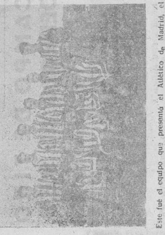
Este fue el equipo que presentó el Atlético de Madrid, el domingo, en El Calvario, ante el Salamanca, al que venció por el leve tanteo de 1-0. De izquierda a derecha, en pie: Mencia, Pérez Payá, Lozano, Galvis, Carlson y Villar; agachados: Silva, Verde, Rabadán, Agustín y Zamora.

El Ayuntamiento de Salamanca, pretendiendo justificar la conducta observada con la «Mariseca» y al efecto, ha publicado una extensa nota en los periódicos de la localidad, en la que «para consiguimiento del vecindario», consigna algunos hechos que, a su entender, son bastantes para justificar ante la opinión. Como el silencio, por nuer parte, autores de la Memoria, no leída a la Junta General de «La Mariseca» y al efecto, se dice textualmente: «y en el presente año de 1952, ante el mal resultado económico de las cuartillas, el excelentísimo Ayuntamiento de Valladolid, concedió a la empresa un donativo de 50.000 pesetas».