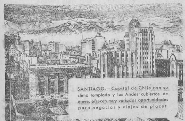
SANTIAGO.—Capital de Chile con su clima templado y los Andes cubiertos de nieve, ofrecen muy variadas oportunidades para negocios y viajes de placer