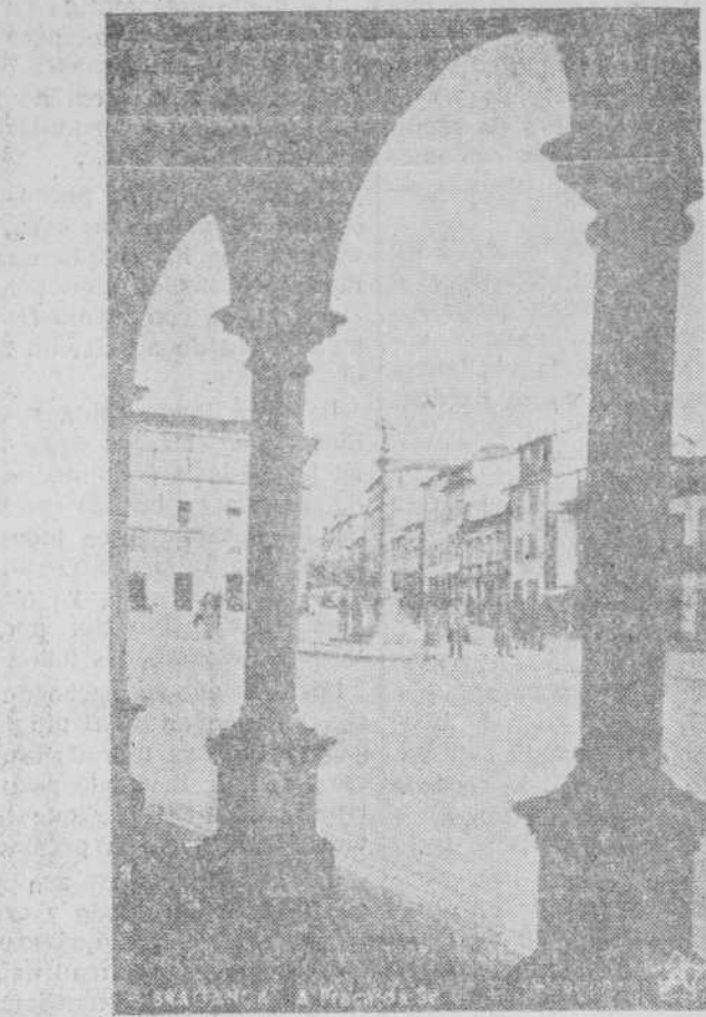
Aspecto de la Plaza de la Sé

A las dos de la tarde, hora portuguesa, se celebró un banquete en honor de los salmantinos, al que asistieron todos los señores Prieto y Ferreira, así como por el comandante militar de la plaza; un representante del excelentísimo Pre'ado de la diócesis; pe idente de la Comandancia del Distrito de Unión Nacional; director del Liceo; comandante de la Legión; delegado del Instituto Nacional de Trabajo y Providencia; delegado de Seguros; director de Estradas; comandante de Policía de Seguridad Pública, y miembros de la Corporación Municipal, así como otras distinguidas personalidades de la ciudad.