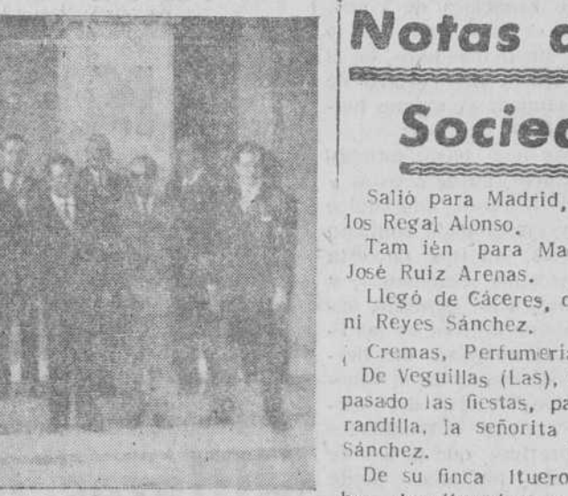
Los representantes de la Sociedad "Amigos de Portugal", con las autoridades de Braganza, en la escalinata del suntuoso edificio del Palacio de Justicia.

mo señor presidente de la Cámara Municipal de Braganza, pronunció unas palabras, expresando su gratitud a los amigos de Portugal en Salamanca, por la entrega del título de socio de honor, haciendo una vibrante y emocionada exaltación de los valores artísticos y monumentales de la ciudad salmantina y haciendo votos por la prosperidad de las dos naciones hermanas.