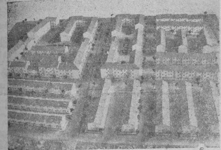
Maqueta del barrio Salas Pombo, que da clara idea de su magnitud en orden a los datos a que se refiere este reportaje

De esperar es, que a próxima estadística nos ofrezca una más risueña perspectiva. Las nuevas viviendas de la Gran Via llevarán a la nueva calle un buen número de habitantes y los barrios de viviendas protegidas también harán decrecer la cifra, y será consolador su reducción a la mitad, porque es ilusorio que pueda llegarse a esa cifra de La Hoya, en que cada dos habitantes pueden ocupar una vivienda. G. G. G.