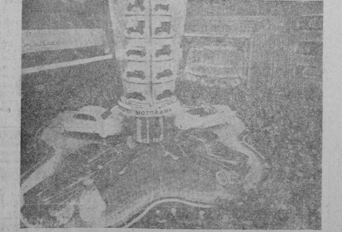
Un pabellón en la Exposición del automóvil de 1950, en el Hotel Waldorf Astoria, de Nueva York. En esta Exposición que se celebra todos los años, los fabricantes exhiben al público sus últimos modelos.