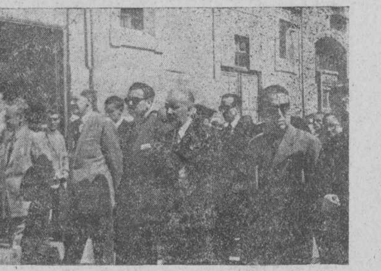
Presidencia del duelo en el entierro del señor García Boiza

EL FUNERAL Y EL ENTIERRO CONSTITUYERON DOS SINCERAS MANIFESTACIONES DE DUELO