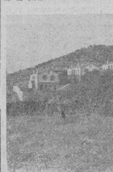
Un grupo de nuevas viviendas en un pueblo de la sierra charra: chalets de Ledrada

mayor parte de los pueblos salmantinos, en la estadística de 1948, a la que se refiere la Reseña Estadística de la provincia de Salamanca, cuyos datos utilizamos para estos reportajes y en peores condiciones, o sea, pasando de cinco habitantes por viviendas, encontramos Sotoserrano de 1.149 habitantes; Tabera,