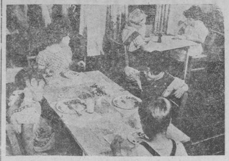
El almuerzo en la Guardería infantil