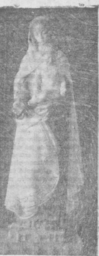
bueno, asombra pensar lo que este joven hará de aquí a diez años...

—Este viene empujando fuerte... —Si a los veintidós años se ha podido producir tanto y tan