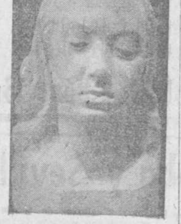
los más variados asuntos — retratos, apuntes, calles, bocetos de monumentos— y seis óleos con motivos de Salamanca y Béjar.

El grupo de dibujos está formado por dieciséis cuadros a tinta, al carbón y a lápiz con