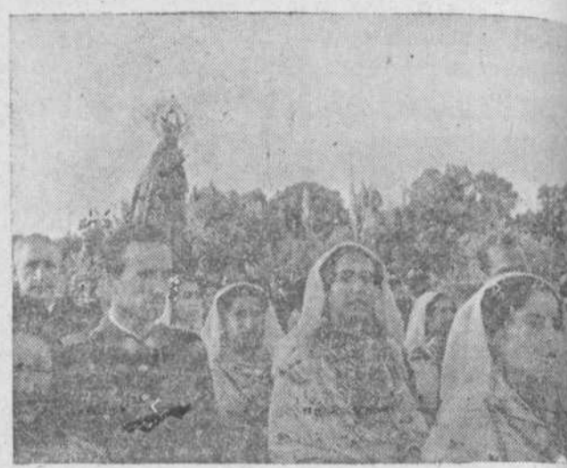
Nuestra Señora de Peña de Francia, acompañada por el dario de Sequeros, sale de la villa, para peregrinar por castaños, los olivos y viñedos de la comarca serrana.

Cuando hace pocos días fulmos a Sequeros con una concreta misión periodística cerca de la Junta de Mandos allí celebrada, no sospechábamos que otra labor informativa podía ofrecérsenos, y no precisamente poco anhorada. Porque los que en lo alto de la Peña de Francia hemos pasado horas inolvidables, completamente cautivados por el ambiente de fervor de aquella altura; y por la belleza que desde ella puede contemplarse, deseamos encerradamente ver a la Virgenita morena en ese peregrinar por los pueblos serranos.