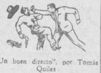
"Un buen directo", por Tomás Quiles