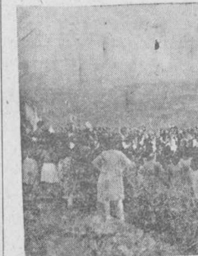
En el "Balcón de la sierra", los vecindarios de Sequeros y Villanueva del Conde se encuentran y éstos reciben la preciada imagen para conducirla entre fiesta y oraciones, a su iglesia parroquial.

Y como el día de su fiesta mayor, en que hemos visto subir a la Peña a los lugartenientes sobre sus mulos y su ropa de gran gala; típicos residuos preciadísimos de una estampa que creímos desaparecida, hoy en Sequeros, como mañana en Villanueva del Conde y después en Cepeda, y tantos otros pueblos, hemos visto a la Virgen de la Peña de Francia rodeada de ferrosos amantes, en oración, en