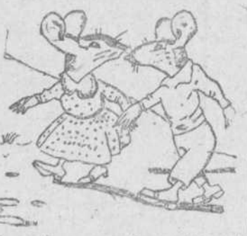
"Los dos ratones", por Manuel García Flores, de Aliba de Tormes

Por la extraordinaria categoría de esta gran superproducción se proyecta HOY en CINEMA SALAMANCA a las 5, 7,45 y 11, y en MODERNO a las 7,30 MODERNO - A las 4,15 - El diablo y yo y BOTON DE ANCLA