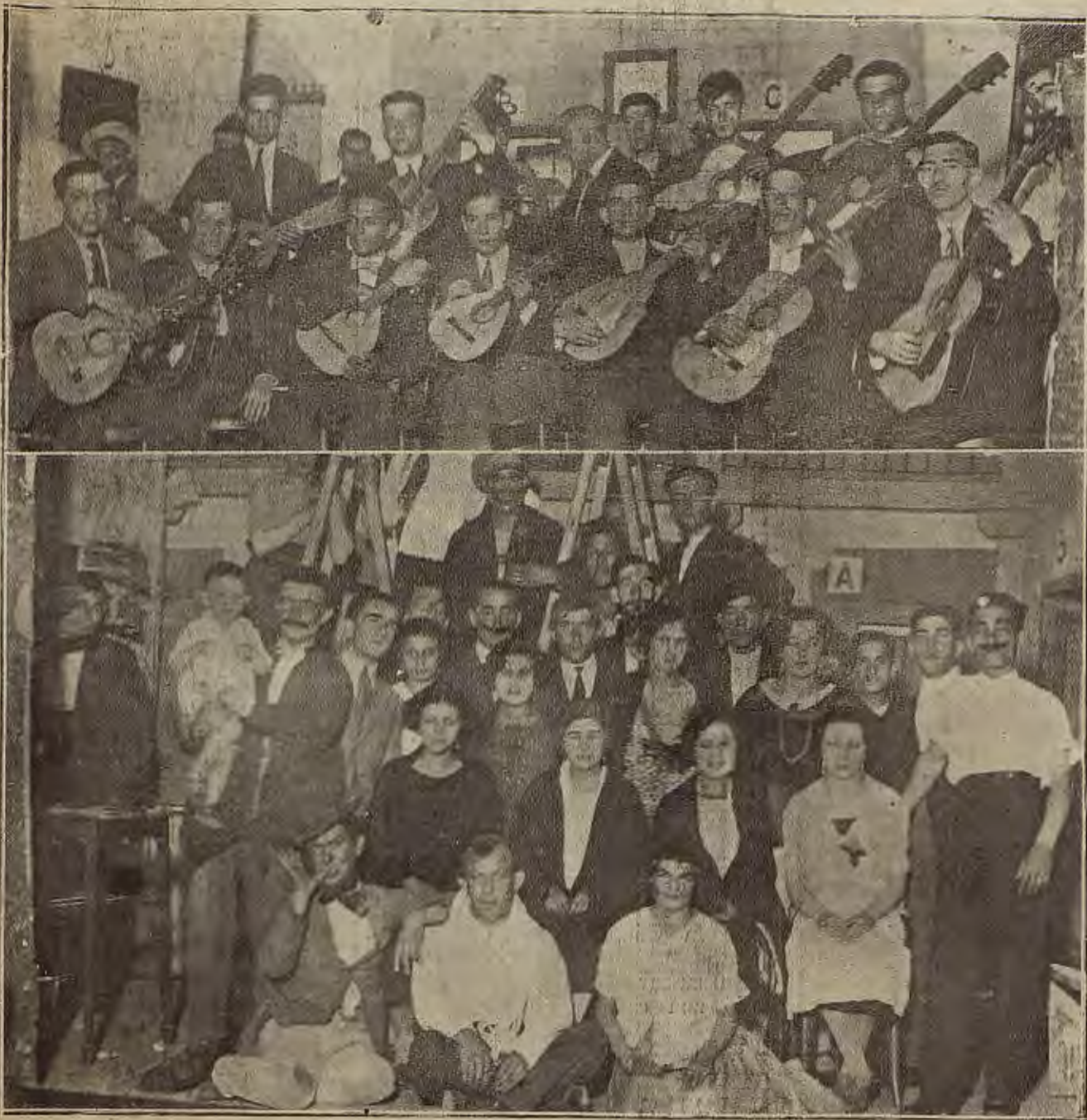
LAS FIESTAS DEL BARRIO DE LAS DELICIAS.—Arriba, la rondalla del barrio, que amenizó los intermedios en la velada que se celebró en el Centro Agrícola. Abajo, cuadro artístico de las Delicias, que tomó parte en el festival.