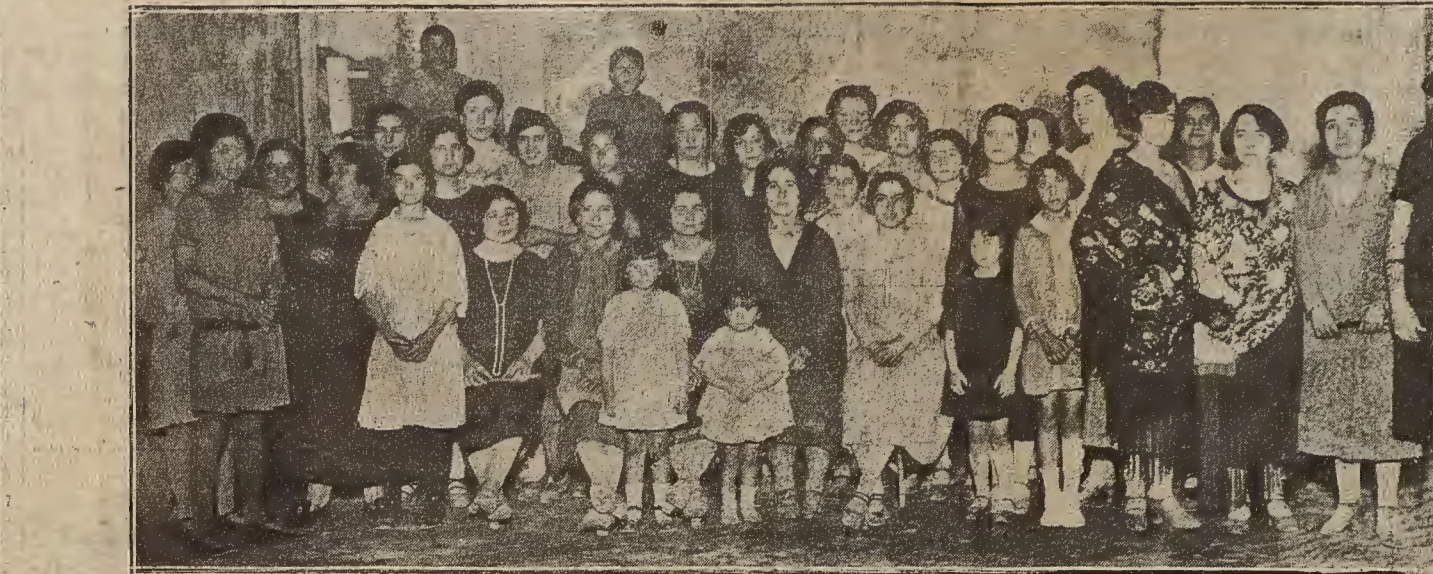
LAS FIESTAS DEL BARRIO DEL AZOQUE.—Señoritas que acudieron a la verbena celebrada en los Campos Elíseos.

Porque aquellos que, siguiendo nuestro consejo, comiencen a leer esta nueva y reciente novela del gran maestro de «La tribuna roja» y de «La rulla», caso de que desconocieran a este escritor ya veterano—que todo es posible en un país donde la curiosidad intelectual no está muy desarrollada—habrán de verse sorprendidos por la admirable forma como el libro comienza; e, intrigados, le seguirán a lo largo de su fábula hasta su término o desenlace, y harán el camino de sorpresa en sorpresa y de alborozo en al-