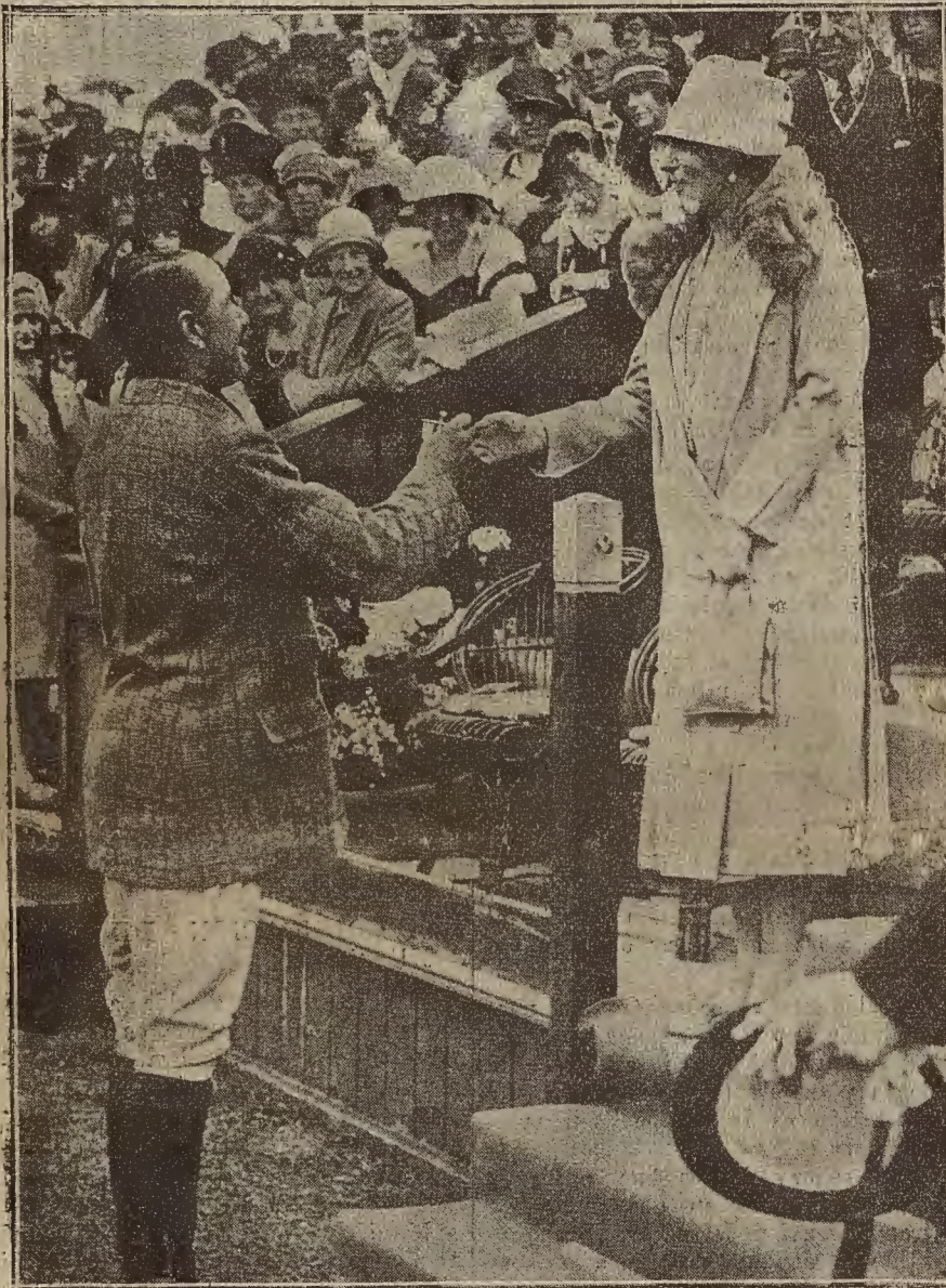
LA REINA DE ESPAÑA EN LONDRES.—Doña Victoria entregando los premios a los ganadores del partido de polo jugado en el campo del Hurlingham Club entre el equipo inglés y el equipo argentino.