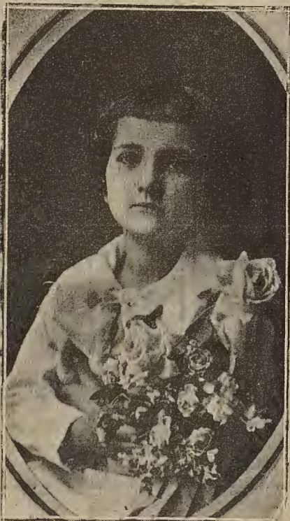
Palarín Grasa Marfín de Cascante (Navarra)

más modestos que todo eso. Bastaría con que habilitasen esas enjambres casitas de estrechas ventanitas por donde ni la luz ni el aire apenas pueden entrar y en cuyas habitaciones la limpieza brilla por su ausencia. Con muy poco trabajo podrían poner esas grandes salas de suelo de losa en pequeñas habitaciones confortables, dignas de que las ocupase cualquier familia de la ciudad. Al que esto escribe se le ha dado el caso de buscar una casa para ocuparla una distinguida familia, la cual estaba encantada de aquel país, y fuese como fuese quería pasar unos días. No habrían transcurrido cuarenta y ocho horas cuando mis amigos vinieron a despedirse porque las gentes del país no tenían ni siquiera ligera noción de lo que es limpieza, (ya no digo higiene), saliendo por la noche abundantes huéspedes indeseables; he de advertir que se trataba de una vivienda que aparentaba un buen aspecto. Creemos que es un factor importantísimo el poder ofrecer un alojamiento decente al visitante.