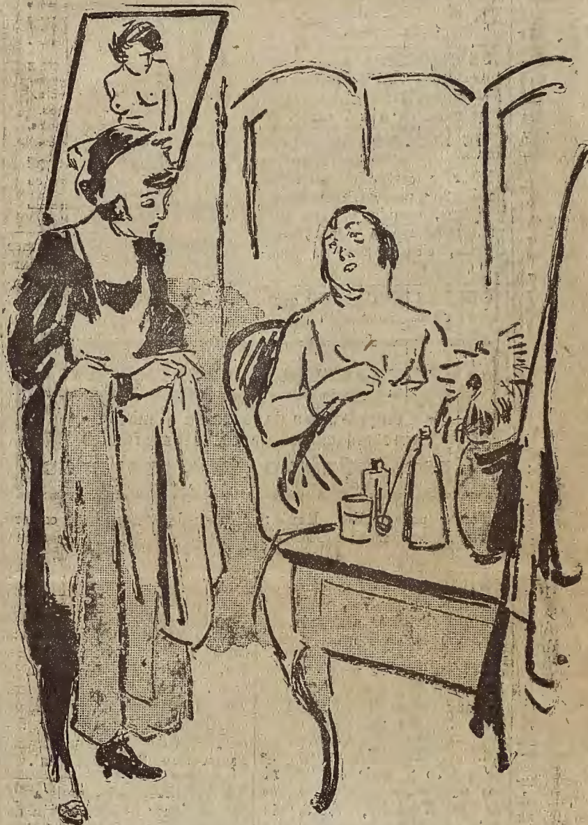
LA MODA, SEGUN LAS HORAS