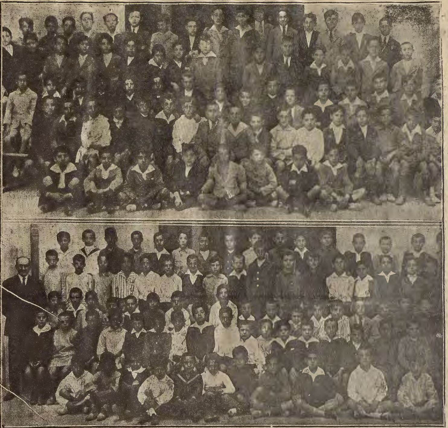
EXPOSICIONES ESCOLARES.—Los niños de la escuela nacional de Santa Marta, fotografiados ayer con motivo de la visita oficial.

La Asociación de propietarios del barrio de la Romareda celebró una sesión que hubo de suspender el presidente, señor García Ruiz, por intemperancia de un señor representante.