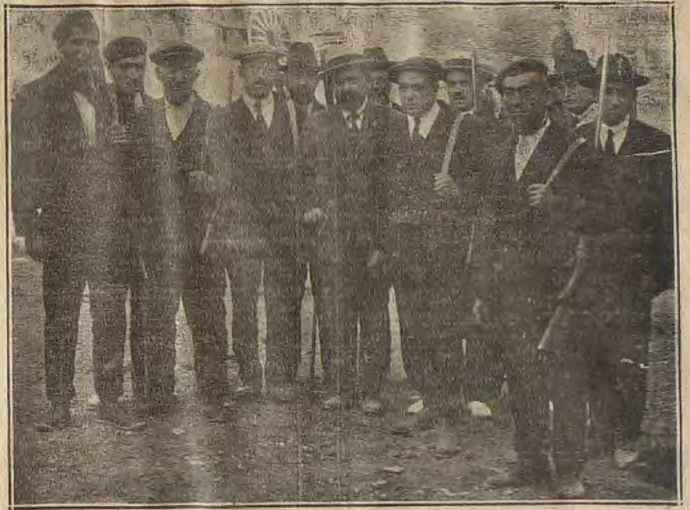
DAROCA.—El Ayuntamiento y el somatén, esperando el paso del general Mayandía

Cubilete es una vasija de barro cocido que resiste a la acción del fuego, cuyos costados son verticales y se usan para preparar los pasteles sin corteza. Los hay redondos, ovalados, cuadrados y largos para las liebres, con su figura en relieve en la tapadera. Todo cuanto