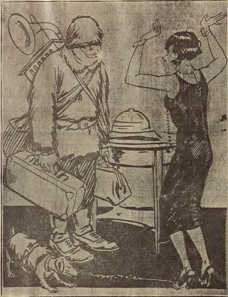
EN SOCORRO DE AMUNDSEN.—¡Cómo! Apenas llegado del Sahara, te vas al Polo Norte... ¡Eso es saltar del atidre al helado Polo!

Además de las varias que celebramos con Madrid, tenemos conferencias telefónicas diariamente con Barcelona y San Sebastián.