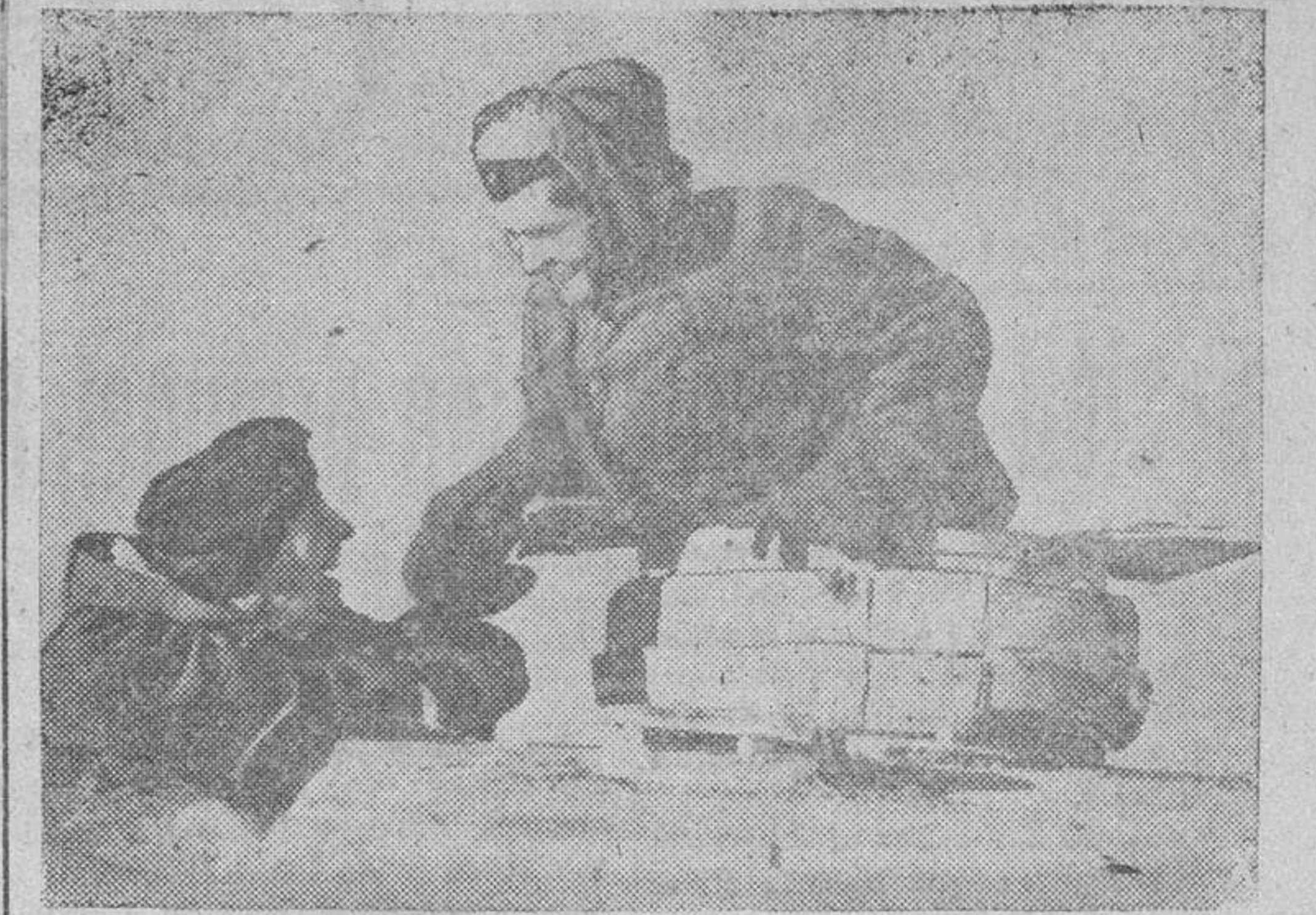
El comandante y el ametrallador de un tanque alemán charlan ahora animadamente después de haber salido victoriosos de una intensa lucha.