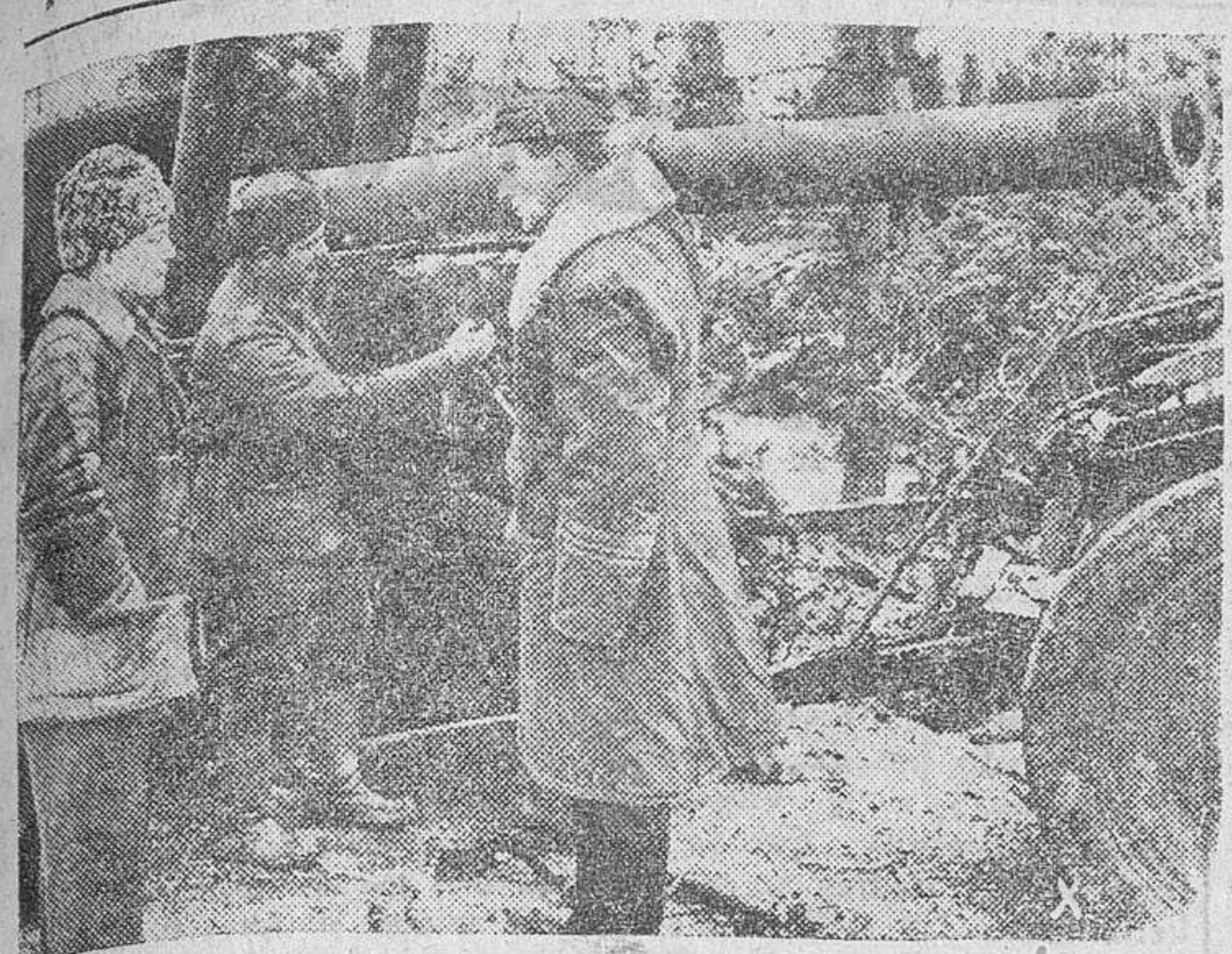
Un jefe finlandés examinando un cañón capturado por sus tropas a los soviets.

ADMINISTRACION: TELEFONO 1018 CALLE DE LA RUA, 13-APARTADO 10