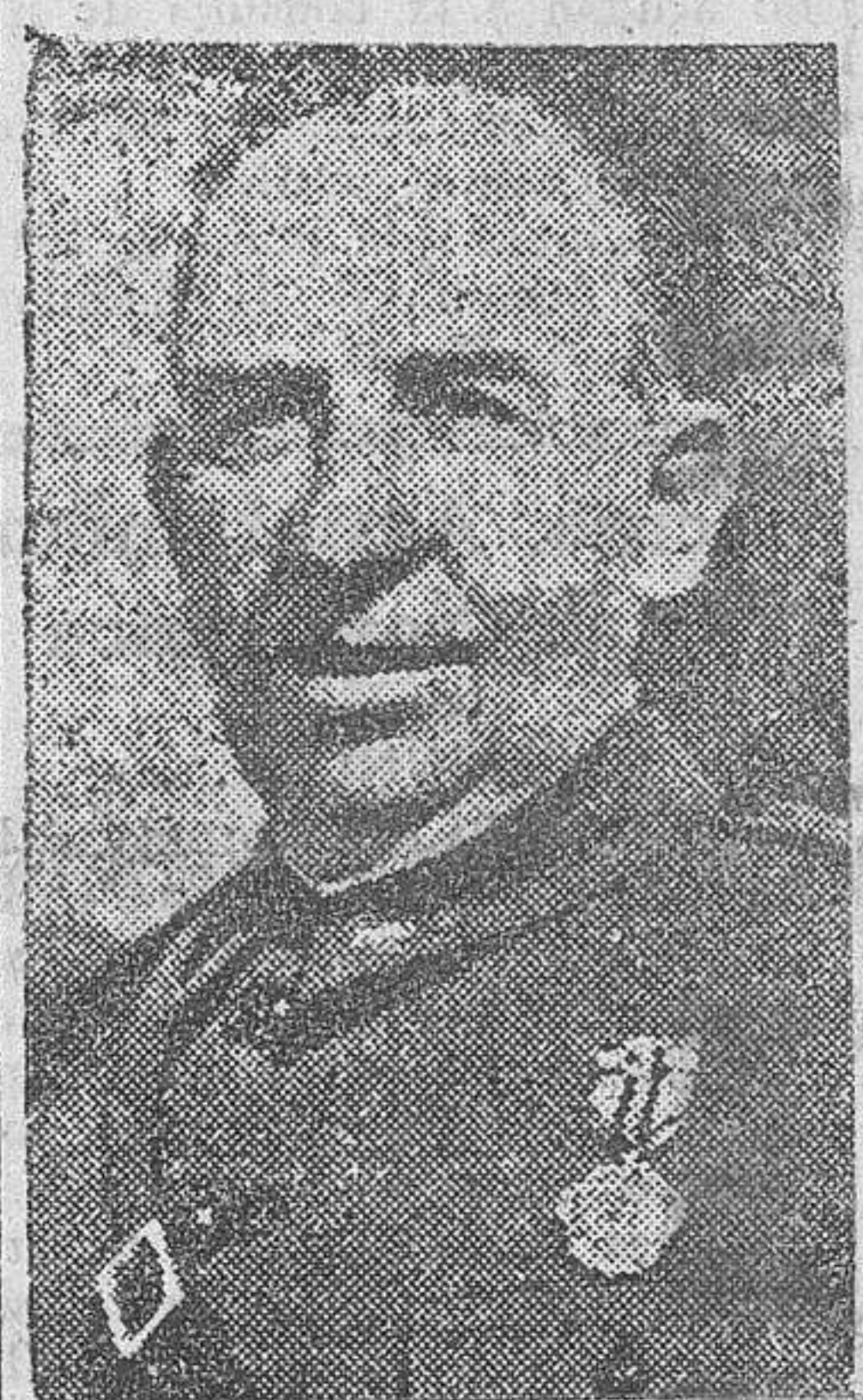
El general Orgaz

Después de saludar a las autoridades que acudieron a cumplimentarles, los ministros se retiraron a descansar. Mañana seguirán su viaje a La Coruña, donde el ministro de Marina, en representación del Ejército, impondrá la Corbata de la Laureada de San Fernando a la bandera del Regimiento de Ingenieros número 8 de aquella guarnición, que fué otorgada en enero del año último por la defensa de su cuartel del Coto, en Gijón, y posteriormente del de Simancas, a cuya guarnición se agregó cuando aquélla era imposible de defender. (Logos.)