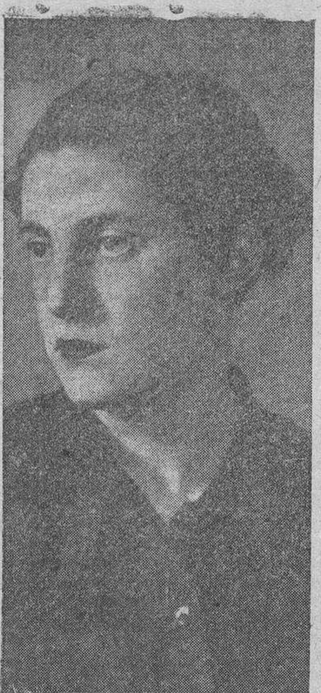
La Delegada Nacional de la Sección Femenina, Pilar Primo de Rivera.

En la mañana de ayer fueron inaugurados los Cursillos para Jefes locales de la Sección Femenina de Falange Española Tradicionalista y de las JONS, inauguración que revistió especial solemnidad, ya que fué efectuada por la Delegada Nacional de la Sección Femenina, Pilar Primo de Rivera. A las once de la mañana, las cursillistas asistieron a una misa y a la iglesia de PP. Capuchinos, en la que intervinieron los coros de la Sección Femenina de Salamanca, y cuya iglesia se trasladaron a la Jefatura Provincial de Falange Española Tradicionalista y de las JONS, para recibir a la Delegada Nacional, a que habían ido a esperar, saliendo al encuentro, el excelentísimo señor Gobernador civil y Jefe provincial del Movimiento, don Gabriel Arias Salgado y de Cubas; la Jefe provincial de la Sección Femenina, María Dolores Gutiérrez, y otras personalidades de la Organización.