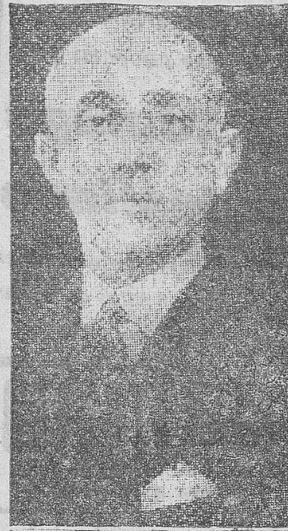
Manuel Prado Ugarteche, nuevo Presidente del Perú

En la izquierda del río Vuoksen, sin que los rusos hayan podido vadearlo. (Efe.) Helsinki.—Los tropas rusas que atacan a Finlandia tienen tres hombres helados de frío por cada herido, según declaran los prisioneros. En el frente rojo hay numerosos comisarios políticos que arreglan continuamente a los soldados. En esta región al norte del lago Ladoga, la alimentación de los rusos deja mucho que desear y los soldados van pesadamente equipados. La G. P. U. actúa intensamente en el refugio. Se hallan entre los prisioneros soldados de diversas minorías étnicas soviéticas. Las tropas siberianas fueron movilizadas a primeros de Octubre. Se generaliza la guerra de emboscadas desde Ladoga hasta el Norte. Los esquiadores continúan con sus ametralladoras a los rusos que quieren desembarcar en la orilla derecha del fiord de Petsamo. Pero no podrán resistir mucho tiempo ante la enorme superioridad de los Soviets, que se muestran indiferentes ante sus propias pérdidas. (Efe.)