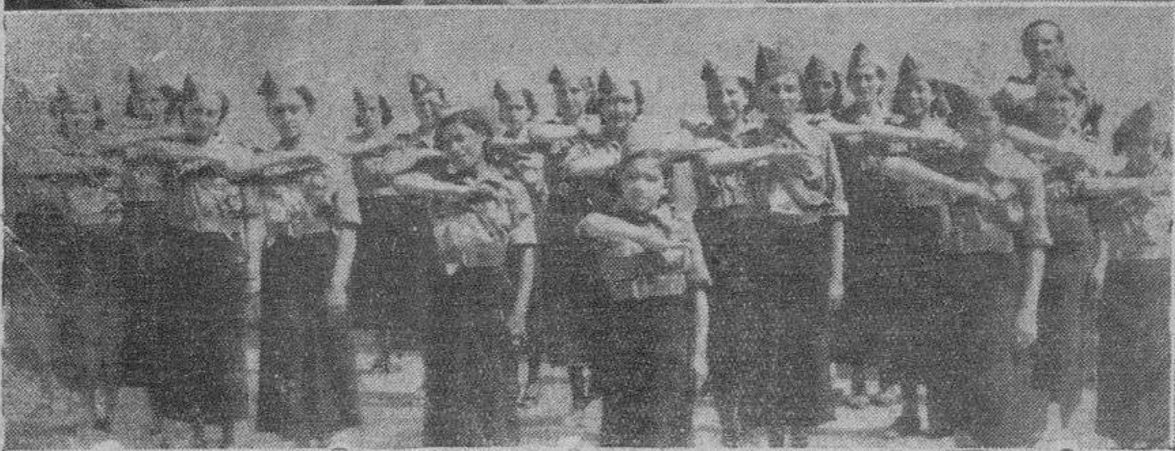
Las secciones masculina y femenina de Acción Popular, de Peñaranda de Bracamonte, posan para EL ADELANTO

mandó abrazarse a obreros y soldados y haciendo pruebas de la sinceridad de las contestaciones a sus preguntas, y tocando las bandas himnos patrióticos y marchas y jotas, culminó el entusiasmo en la despedida que el pueblo zamorano tributó a don José Millán Astray, despedida tan ruidosa y entusiasta, que a poco hacen saltar nuestra modulación en la emisora.