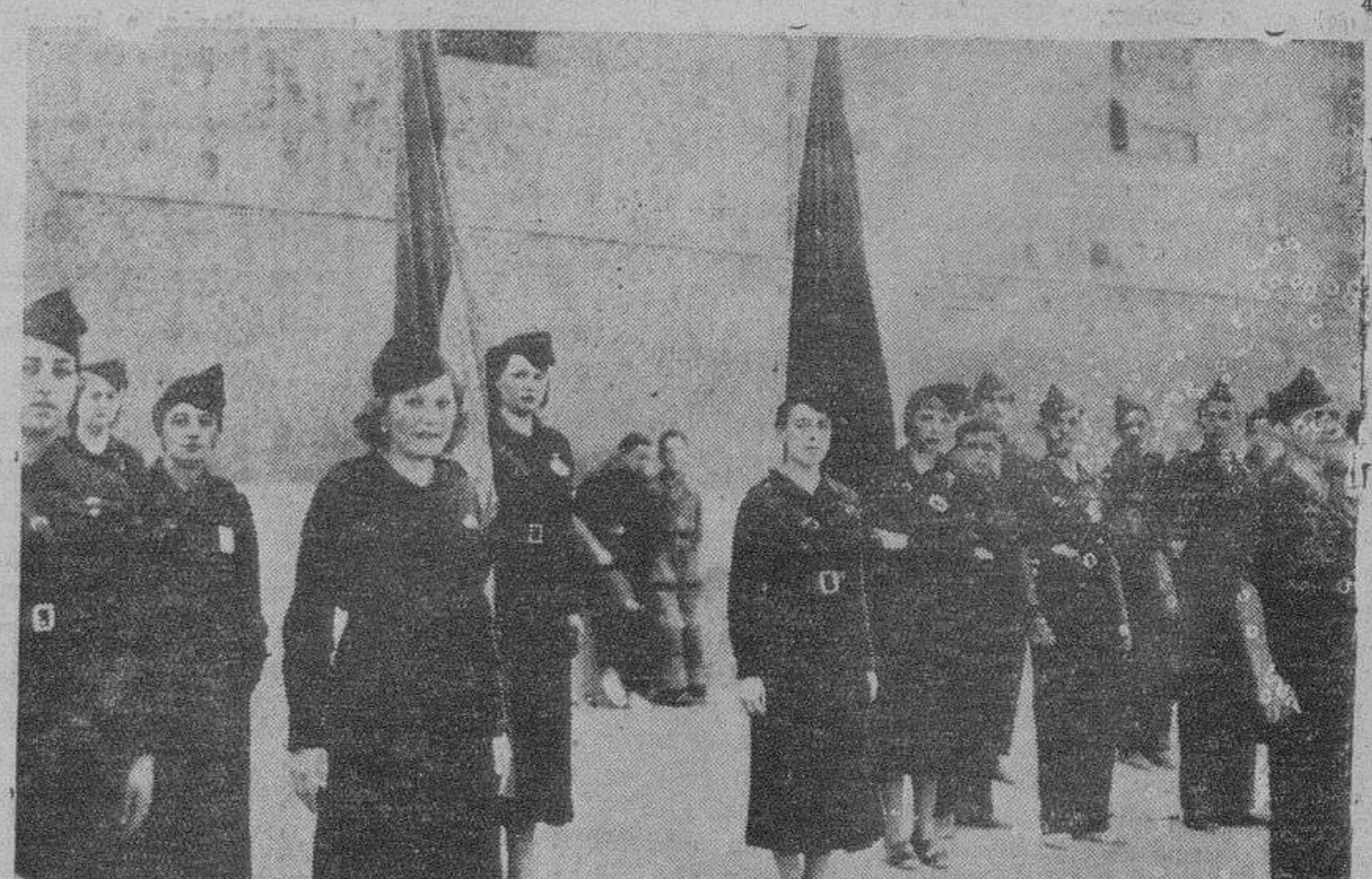
En todas las escuelas nacionales fué repuesto ayer el santo Crucifijo. Al grupo escolar de la Alamedilla asistieron varias secciones de Falange Española, con sus banderas. He aquí un aspecto de la formación.