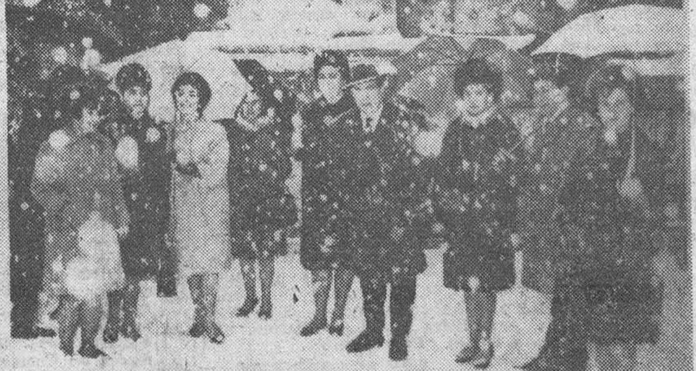
La Organización Nacional de Ciegos, la Cofradía de Santa Lucía y el Gremio de Sastres conmemoraron ayer solemnemente su fiesta patronal, de la que recogemos las precedentes plazas: la primera relativa a la ceremonia celebrada en la Catedral; la segunda —con impacto de la nieve que copiosamente cayó durante todo el día— en que figura un grupo de concurrentes al acto que tuvo como marco la iglesia de San Lorenzo.

SITUACIÓN DE LAS CARRETERAS Y PUERTOS Madrid.—La Dirección General de Carreteras facilita, a las veinte horas, la situación de las carreteras y puertos: Carreteras: Segovia, en la de Sorla a Plasencia, entre Torre Caballeros y Ayllón, uso obligatorio de cadenas. Palencia: Cerrada entre Alar del Rey y el límite de la provincia de Santander. Puertos: BURGOS.—Uso obligatorio de cadenas, en la carretera de Madrid a Irún, desde Aranda de Duero a Miranda de Ebro, incluido el (Pasa a última página)