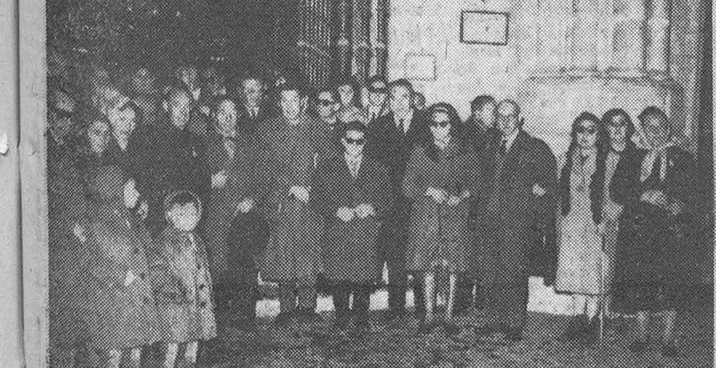
La fiesta de Santa Lucía La Organización Nacional de Ciegos, la Cofradía de Santa Lucía y el Gremio de Sastres conmemoraron ayer solemnemente su fiesta patronal, de la que recogemos las precedentes plazas: la primera relativa a la ceremonia celebrada en la Catedral; la segunda —con impacto de la nieve que copiosamente cayó durante todo el día— en que figura un grupo de concurrentes al acto que tuvo como marco la iglesia de San Lorenzo. — Fotos FEDE.

Base de Holloman de las fuerzas aéreas (Nuevo México).—Con tiempo perfecto ha sido lanzado un gigantesco globo con ayuda del cual se espera conseguir por primera vez una imagen clara de las estrellas. Los dos hombres que viajan en el interior de la barquilla ascenderán hasta una altura de 26.100 metros. Permanecerán en el espacio durante 20 horas y regresarán luego a la Tierra, aterrizando a unos 160 kilómetros de esta base. Si tiene éxito, el proyecto «Stargazer» colocará al astrónomo William C. White —quien realizará su primera ascensión— y al capitán de las fuerzas aéreas Joe Kittinger en posición de emprender una exploración de las estrellas jamás soñada hasta ahora, usando un telescopio a más de 26.000 metros de altura, en donde no habrá apenas interferencias atmosféricas. Los pocos horas antes del lanzamiento se produjo una pequeña avería que fue reparada rápidamente, aunque no sin que motivara algún retraso en el comienzo de la operación.—Efe.