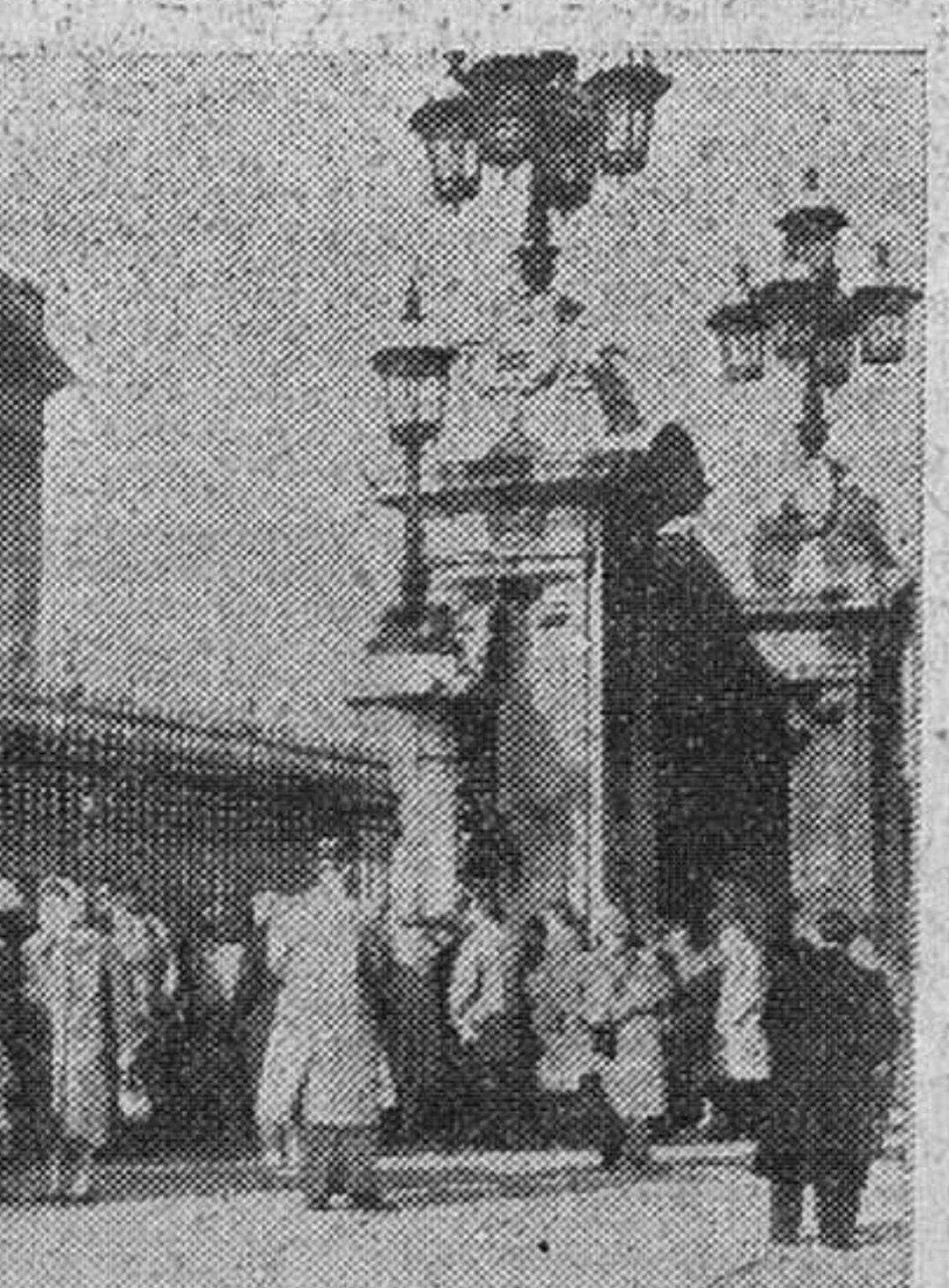
Quiéren ser los primeros en saber si vino la cigüeña

Madrid.—La Comisión consultiva para el crédito a medio y largo plazo se reunió en el Ministerio de Hacienda bajo la presidencia del señor Navarro Rubio. Los reunidos deliberaron sobre multitud de asuntos de trámite económico-ordinario.