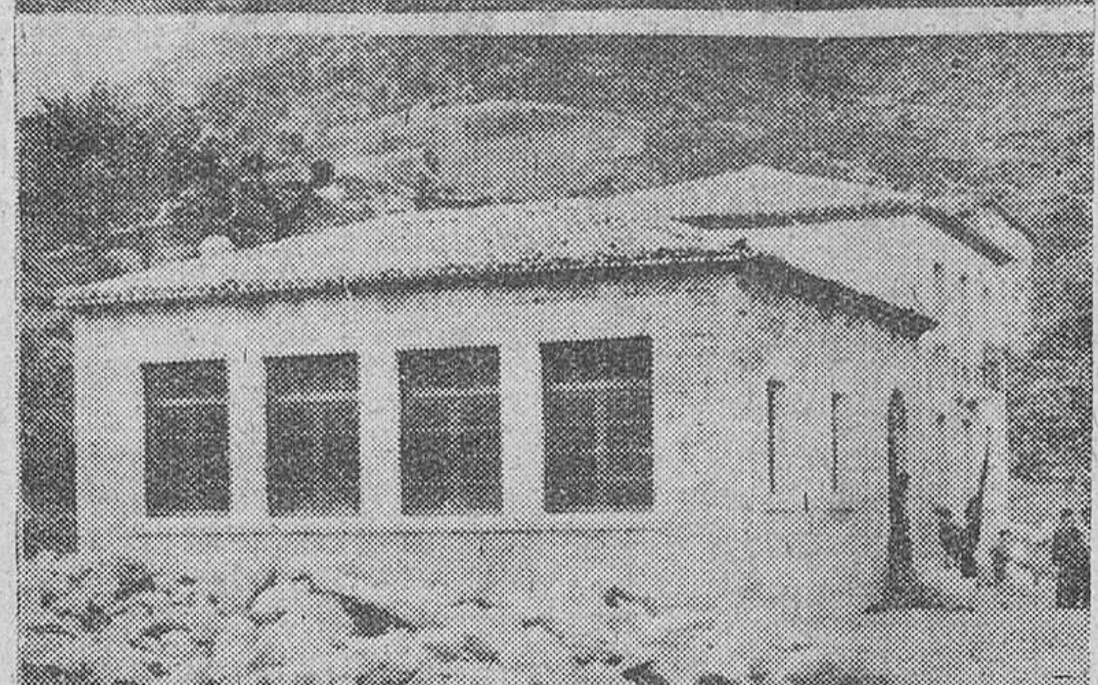
Se reproducen en nuestro grabado las nuevas edificaciones inauguradas ayer por el gobernador civil en Hoz de Valdivielso (escuela y vivienda para el maestro) y en San Martín del Rojo (vivienda destinada al maestro)