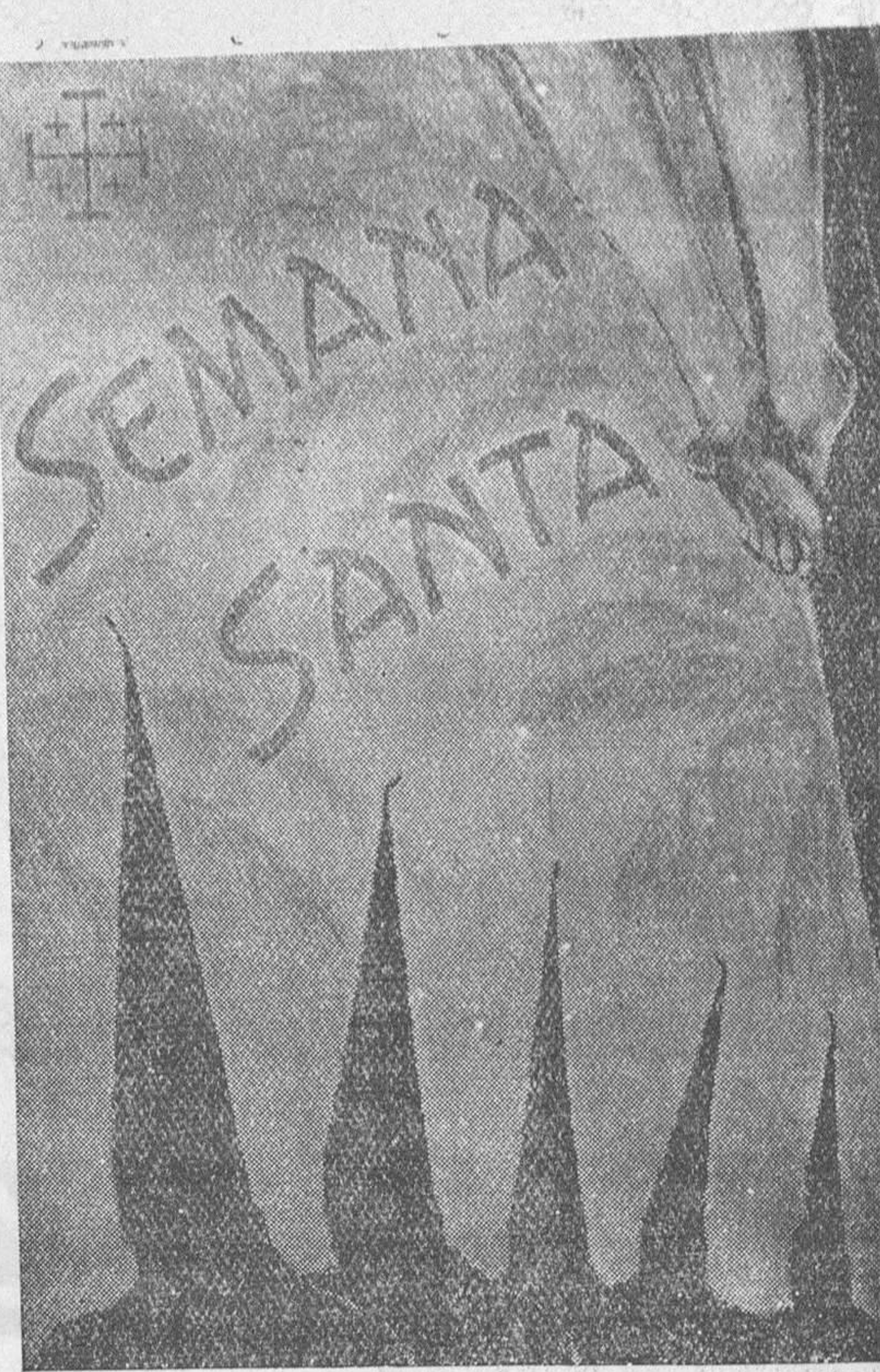
Santa Isabel de Fernando Poo.— Cartel anunciador de la Semana Santa que se celebrará en esta capital de la Guinea Española.