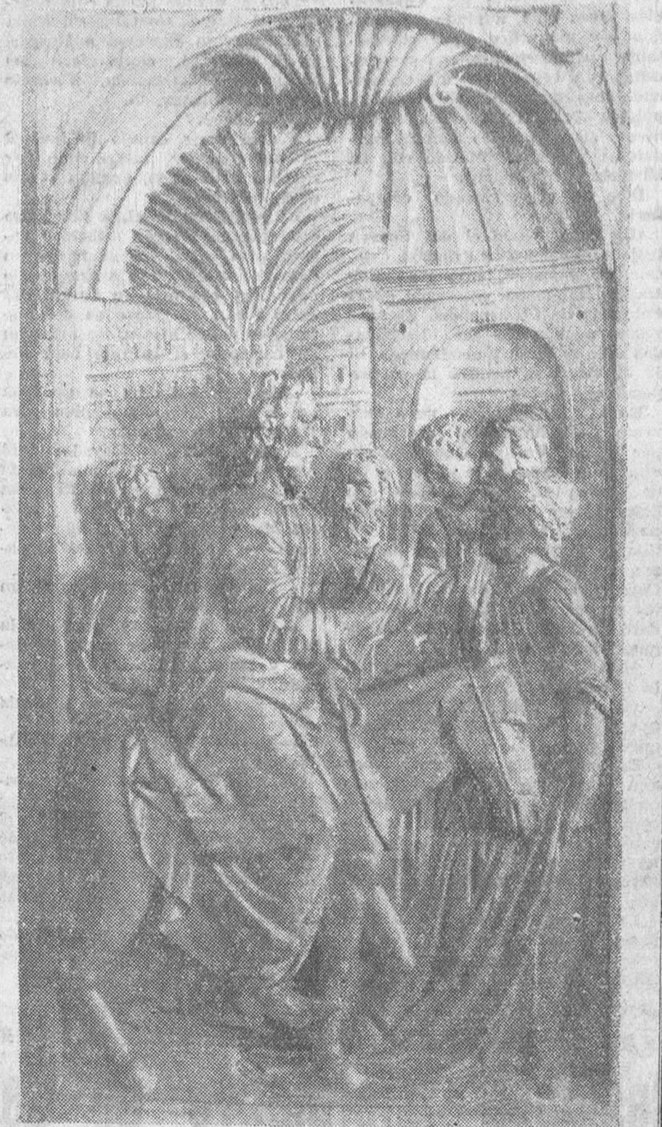
Primera jornada de La Semana Santa. Primer día de esta semana memorial que tendrá un digno remate en los esplendores de la Resurrección, pero no sin pasar antes por los dolores y tormentos del Viernes Santo.

Se ha facilitado a la Prensa una nota sobre el ingreso de España en la Cooperación Económica de Europa en la que se hace constar que se ha demostrado la necesidad de abordar con una solución específica el problema de los países europeos no desarrollados dentro del área del libre comercio, a los que no es posible aplicar las fórmulas generales del área, puesto que su industrialización sufriría un fuerte retro-