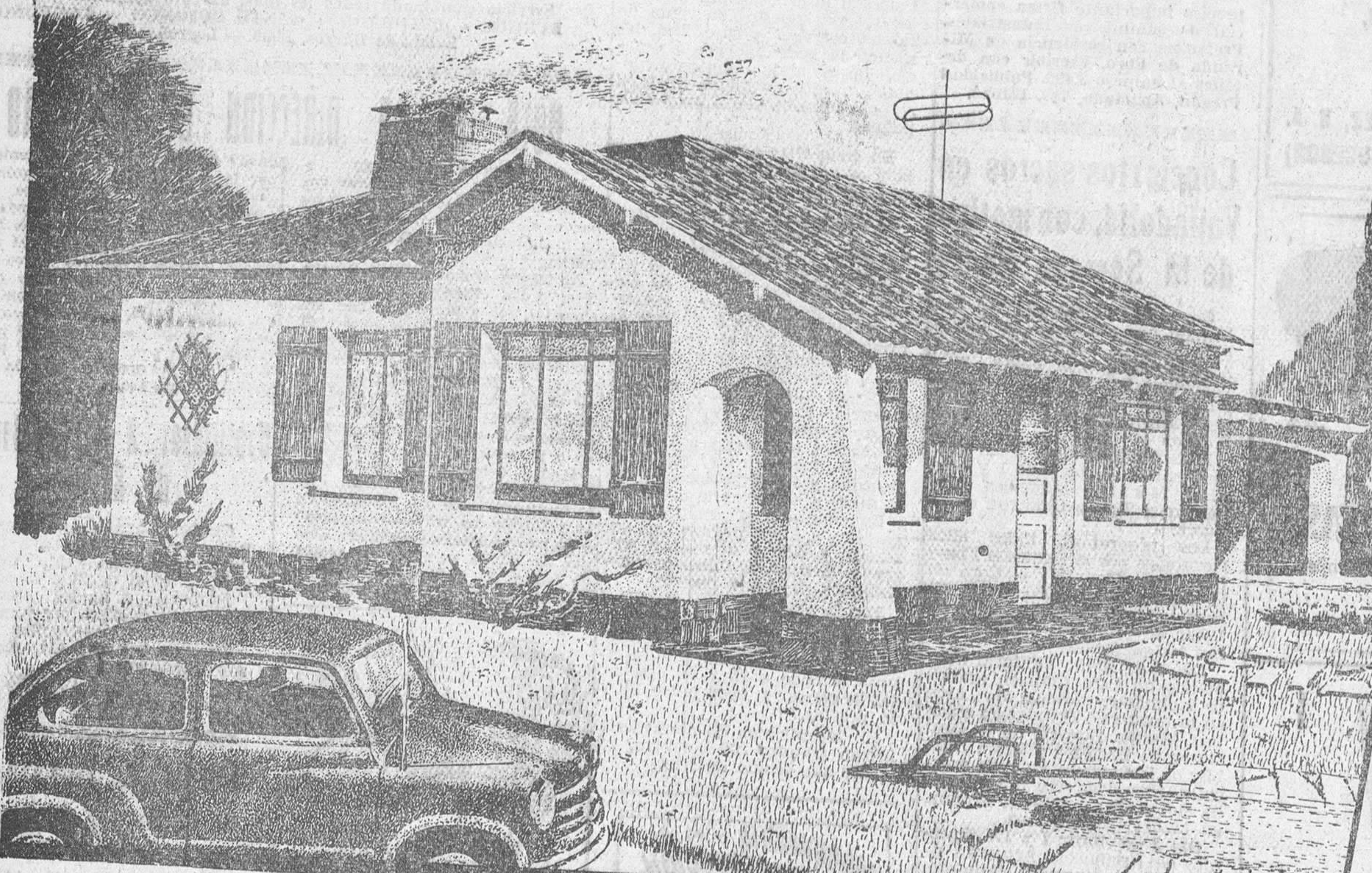
Proyecto del chalet que se regala: Recibidor, comedor, living, 2 dormitorios, cuarto de baño completo, aseo, cocina, garage, etc... Se construirá en el lugar elegido por el afortunado, dentro de las bases del sorteo.