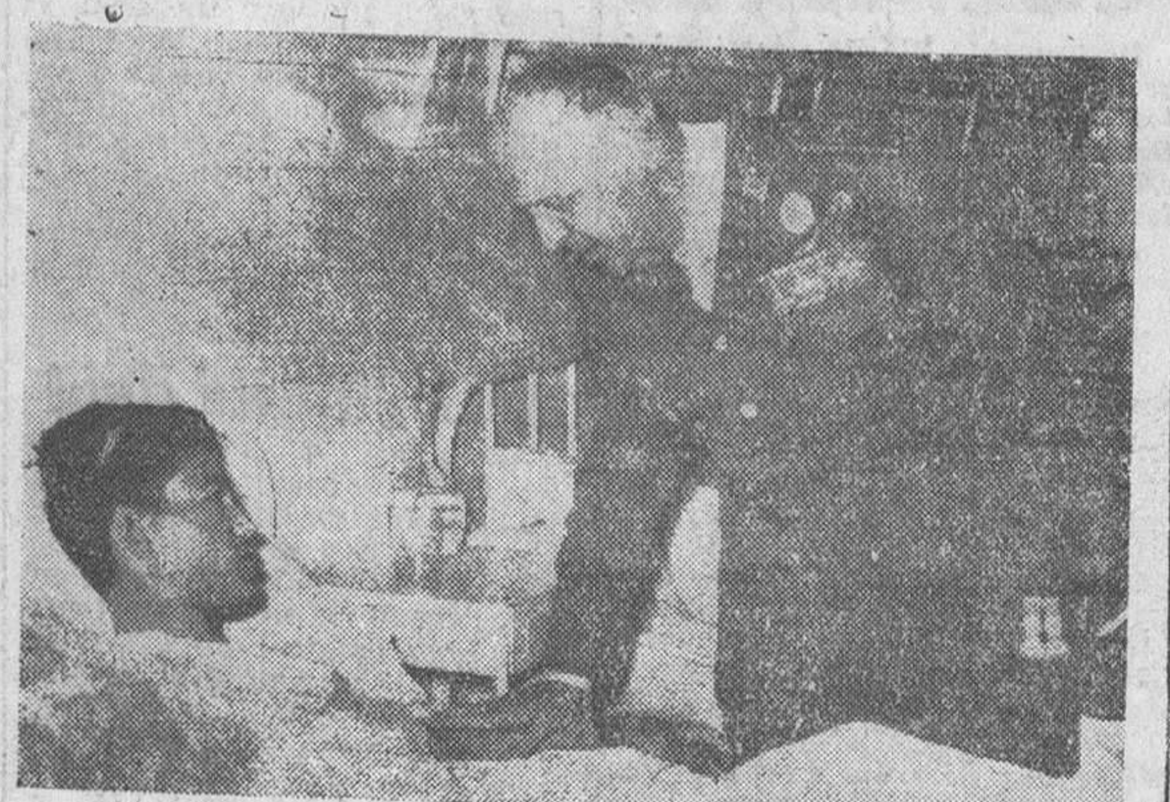
Las Palmas. — Con motivo de su estancia en esta capital, el teniente general Barroso visitó el Hospital Militar y conversó con algunos heridos en el Africa Occidental Española.