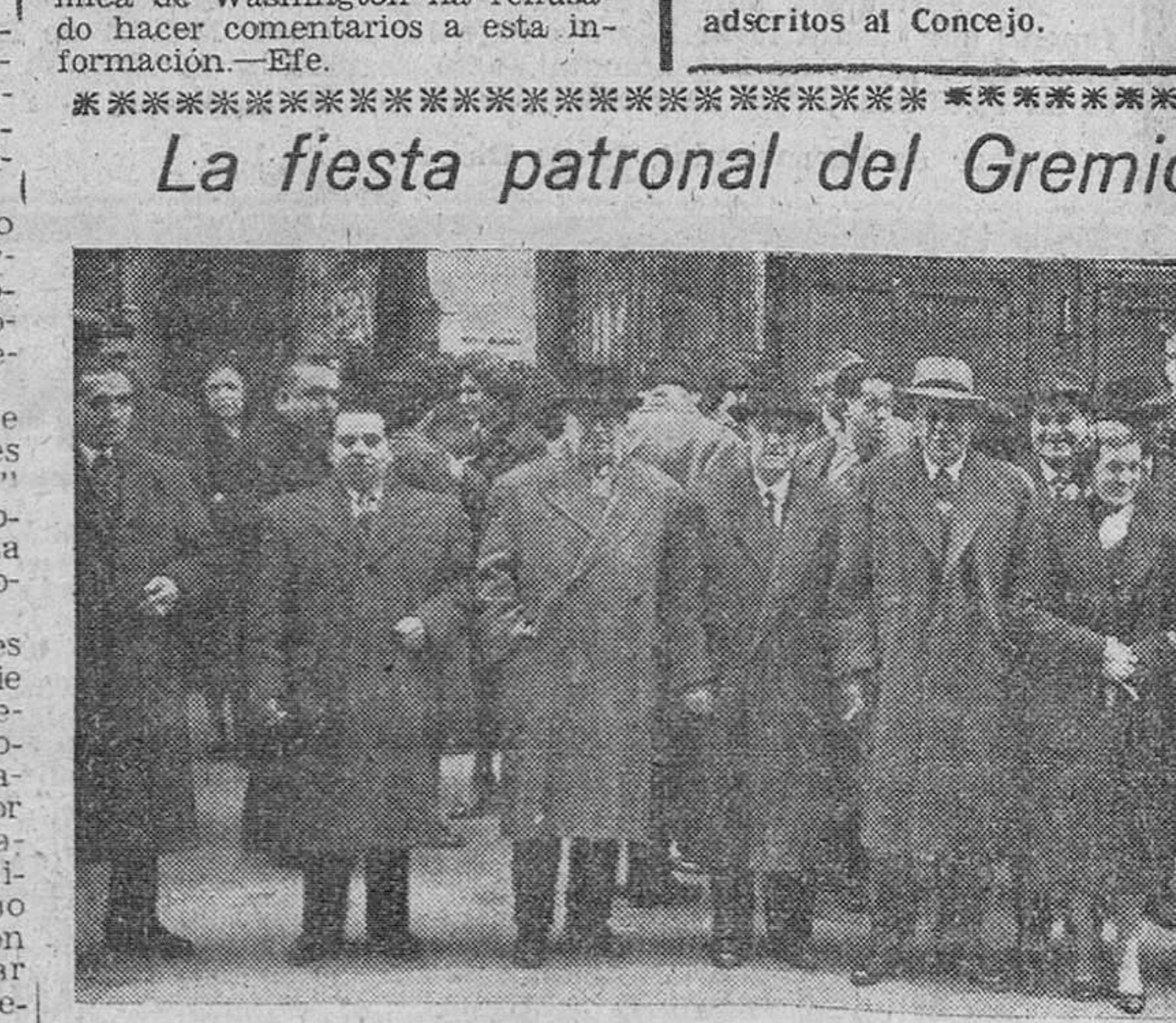
Profesionales burgaleses del Gremio de los Sastres, que ayer conmemoró la fiesta de su Patrona, Santa Lucía, fotografiados a la salida de la iglesia de San Lorenzo, donde asistieron a una solemne misa.

La fiesta patronal del Gremio de los sastres