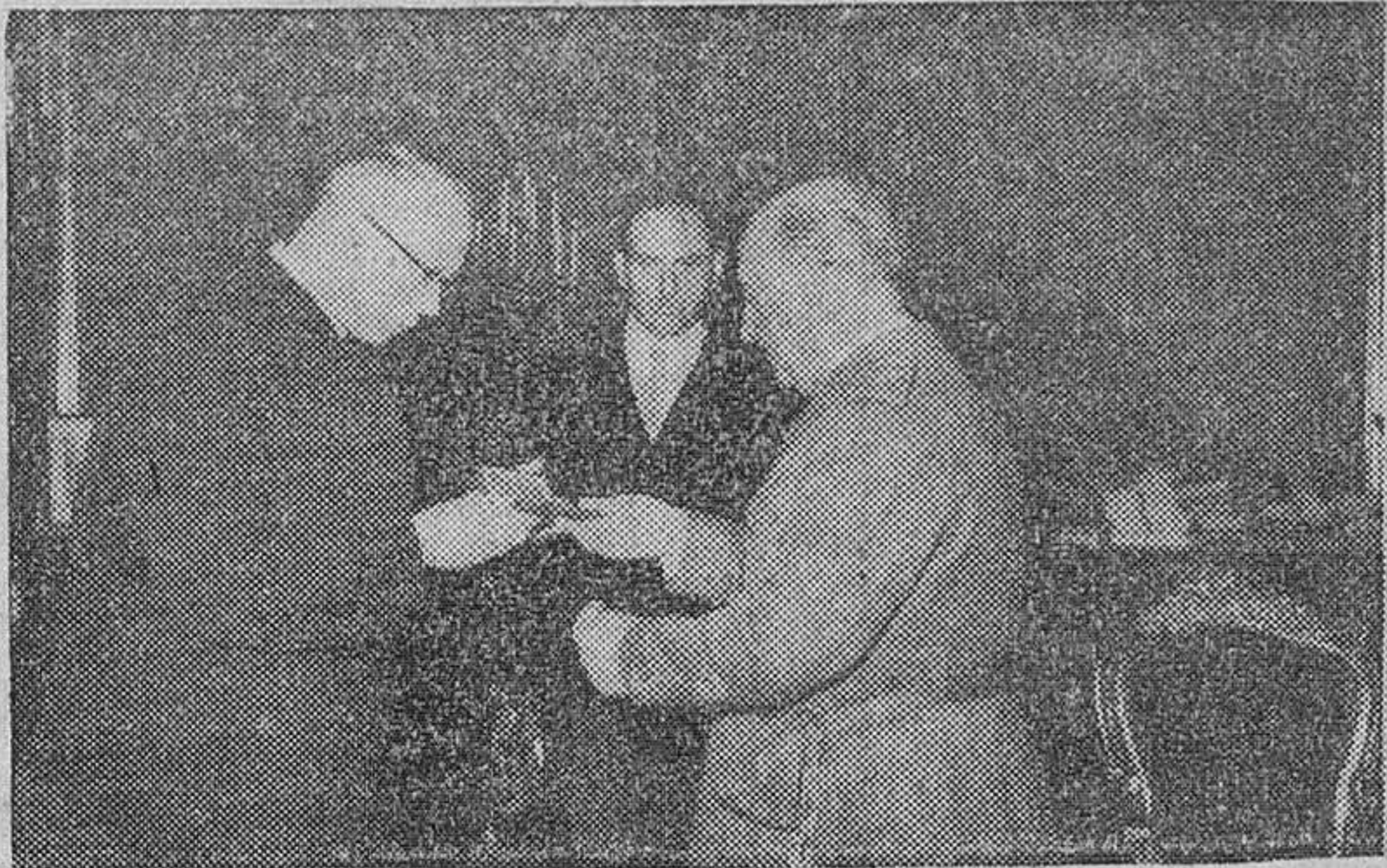
Madrid. — Un momento de la audiencia concedida por Su Excelencia el Jefe del Estado al Padre Beda, prior del monasterio benedictino de Marizell, en Austria, el cual hizo entrega al Caudillo de la Medalla de Plata de dicho monasterio.