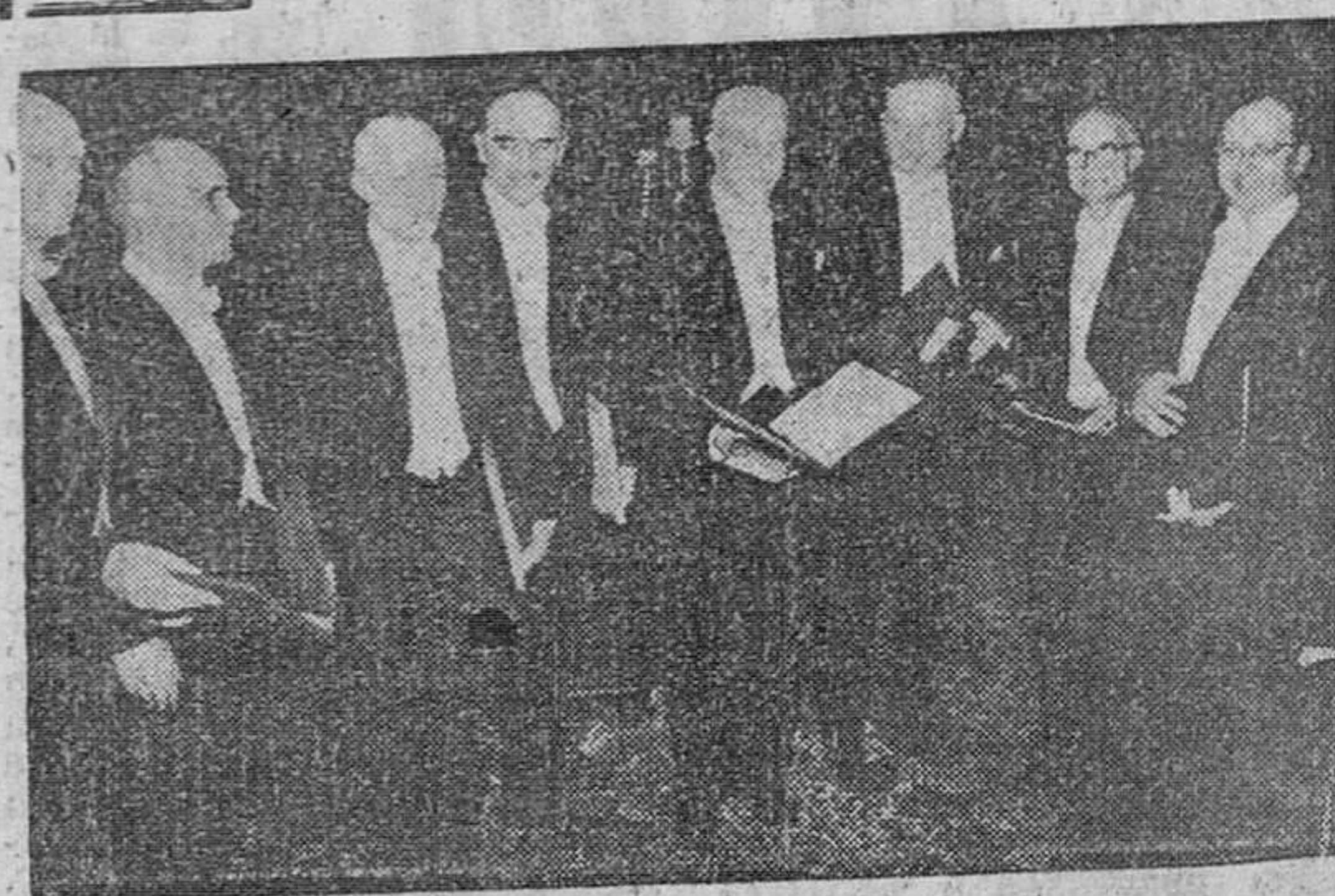
Estocolmo.—De izquierda a derecha: Dickinson W. Richard, Andre F. Courand, Sir Cyril Norman Hinshelwood, Nikolaj N. Semenov, Walter Houser Brattain, Werner Forssmann, William Shockley y John A. Bardeen, galardonados con los Premios Nobel juntamente con el poeta español Juan Ramón Jiménez, (que no pudo asistir al acto), después de recibir su premio.