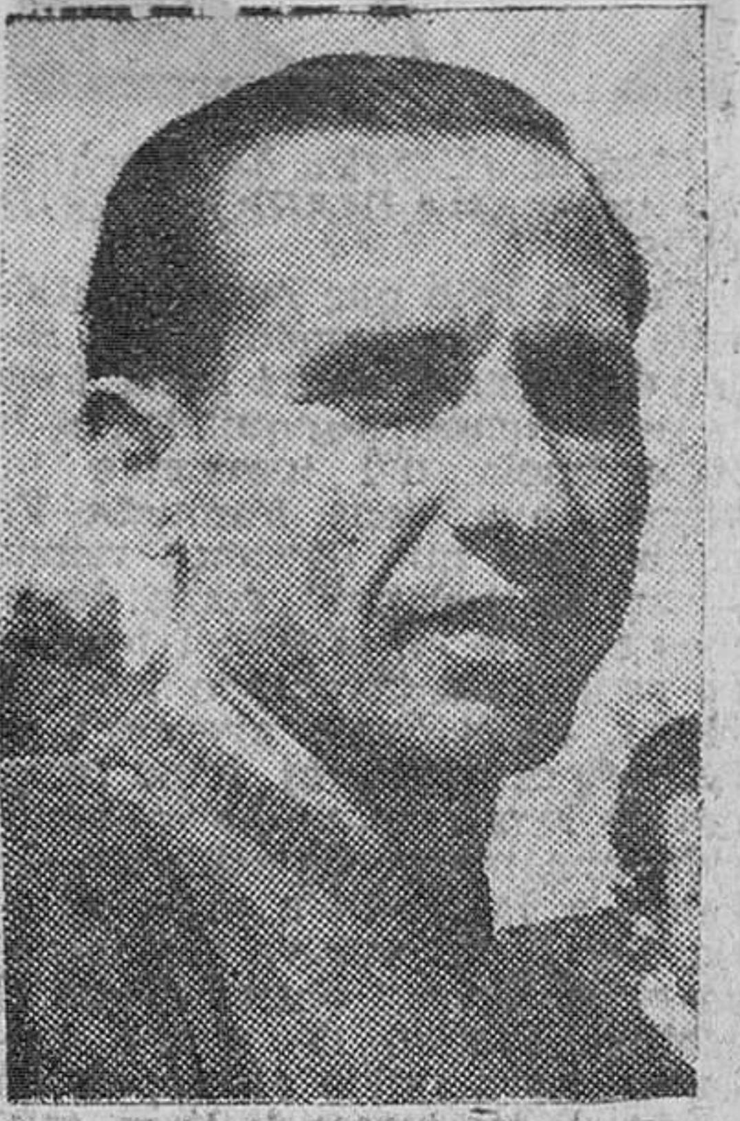
Palma de Mallorca. — Sobre las nueve de la mañana...

El sepelio constituyó imponente manifestación