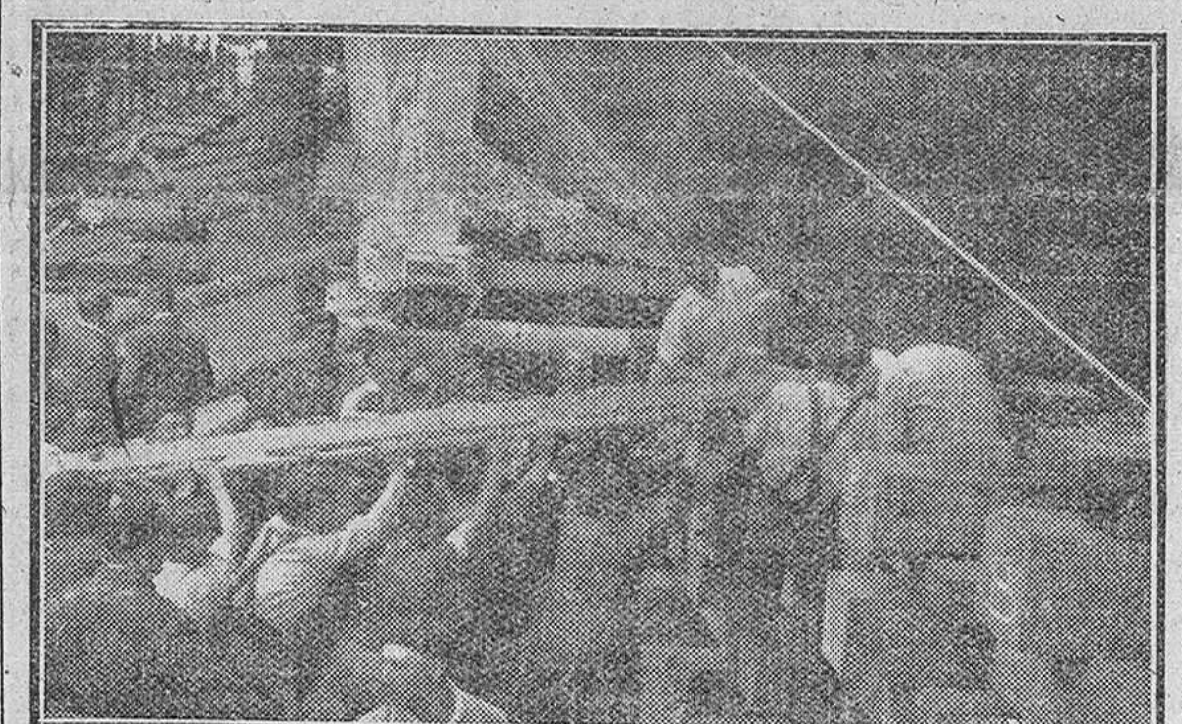
En los astilleros españoles, se trabajó intensamente durante el año 1947. He aquí el momento de la botadura de un nuevo barco, de pequeño tonelaje, para la flota mercante nacional.

IX Once barcos, con 48.000 toneladas y un coste de 325 millones de pesetas, se han puesto en servicio en 1947