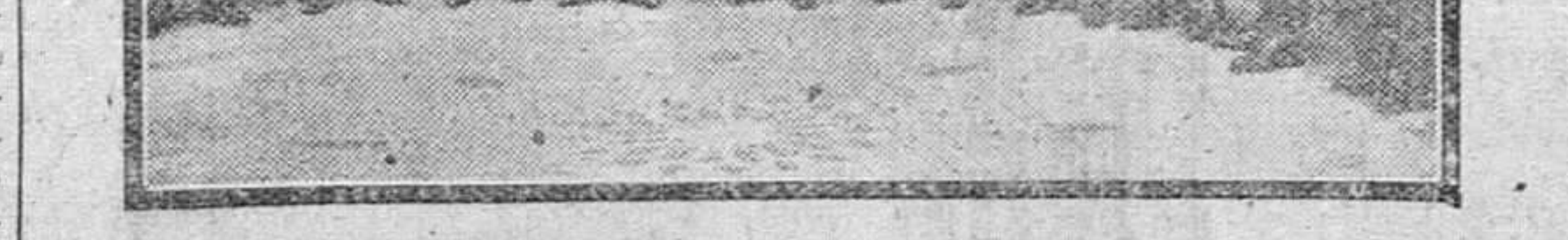
Madrid.— Los miembros de la Misión Militar argentina al frente de su jefe, general Ayalos, con el embajador de su país en España y otras personalidades, momentos después de su llegada a esta capital.