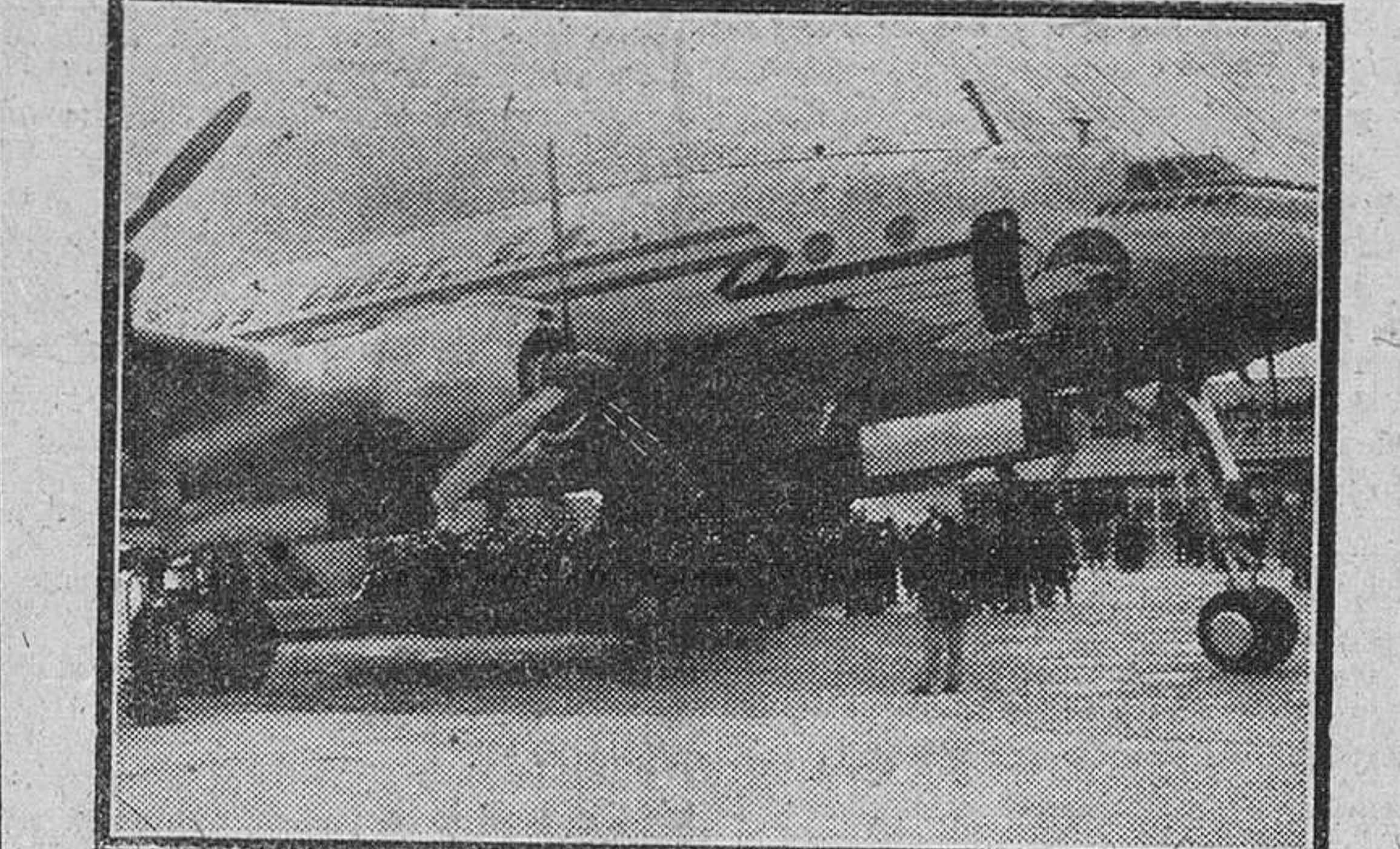
Madrid.— Un aspecto del aeródromo de Barajas en el momento en que tomó tierra el avión "Veracruz", en su viaje inaugural de la línea aérea Méjico-Madrid.