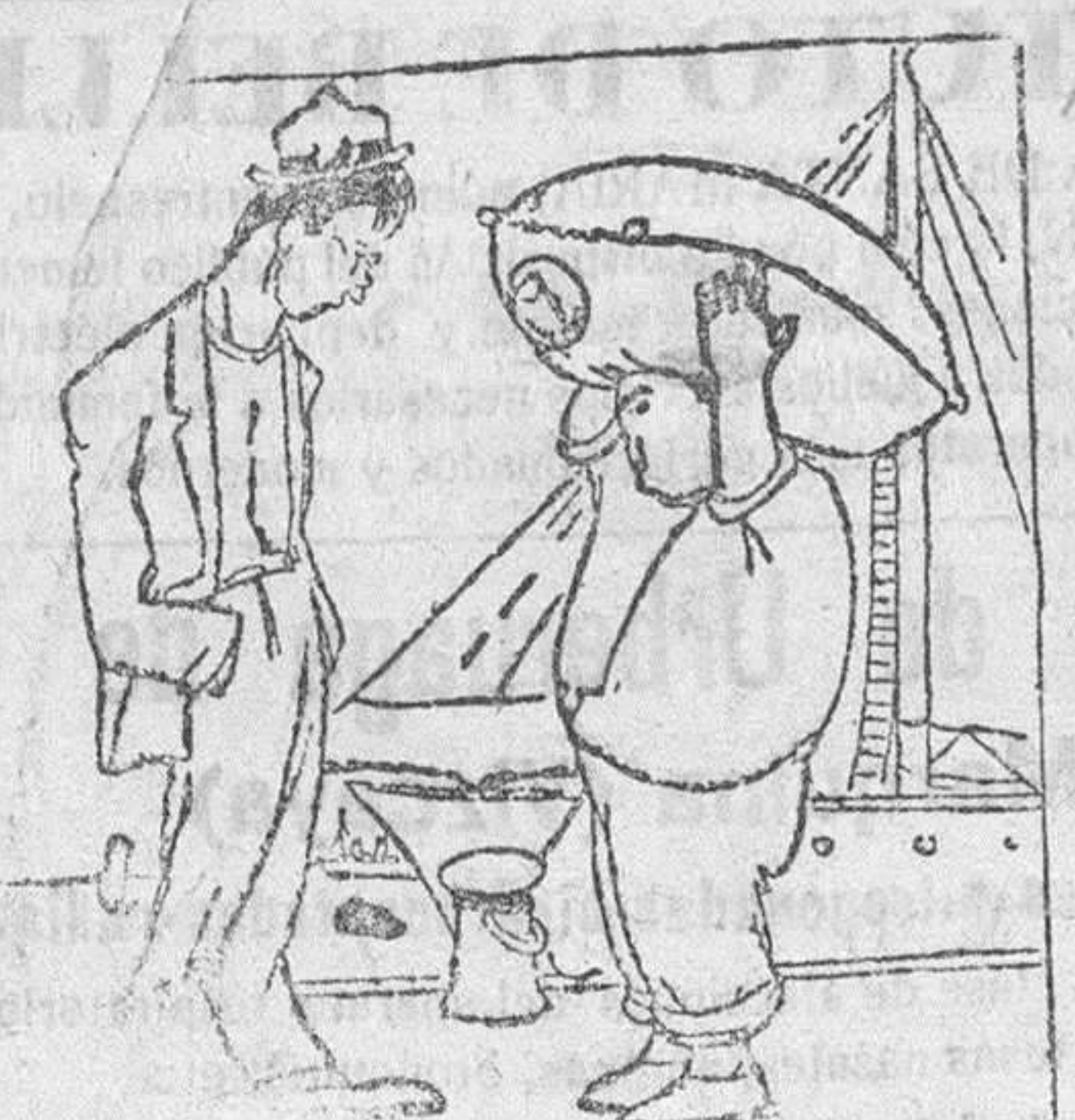
Me han dicho que eres un prodigio cargando sacos ¿Por qué no te d.n más jornal? ¡Qué quieres; los trabajos de cabeza son los peor retribuidos!

Terminó diciendo: Los maestros que no estén conformes con la República deben retirarse, pero no sabotarla.