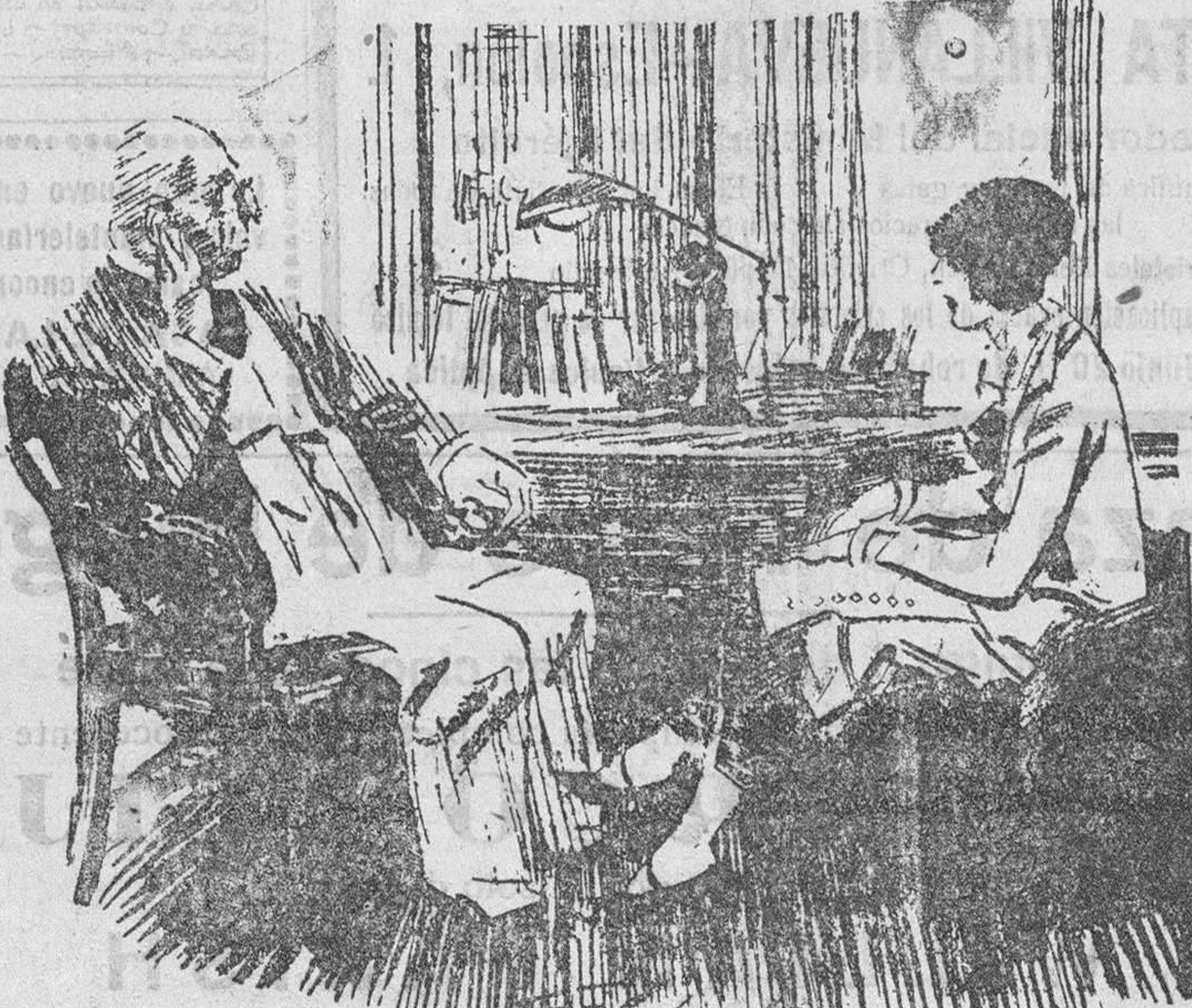
El doctor.—Va a ser muy difícil de evitar eso de que su marido hable alto por las noches. La esposa.—No; si lo que yo quiero es saber qué podrá hacerse para que hable más claro.