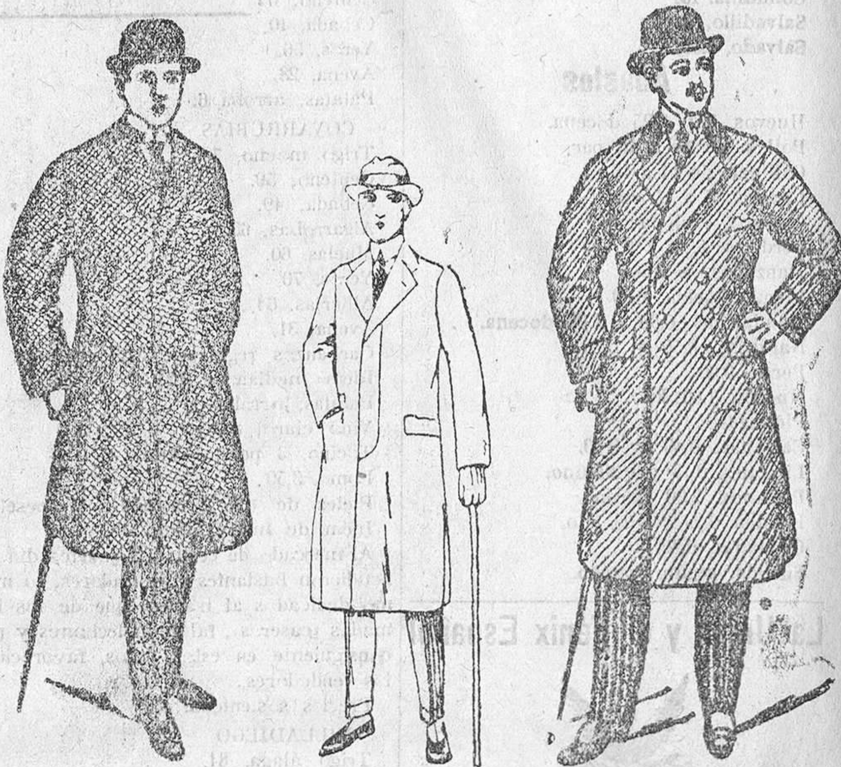
Gabán forma corriente paganda de la Casa a 40 pesetas. Gabán paño Melton, forma semientallado, a 60, 70, 80 y 90 pesetas. Abrigo entallado y cruzado gran confección a 100, 120 y 150 pesetas.

Gran casa de tejidos, pañería y confecciones de caballero, señora y niños