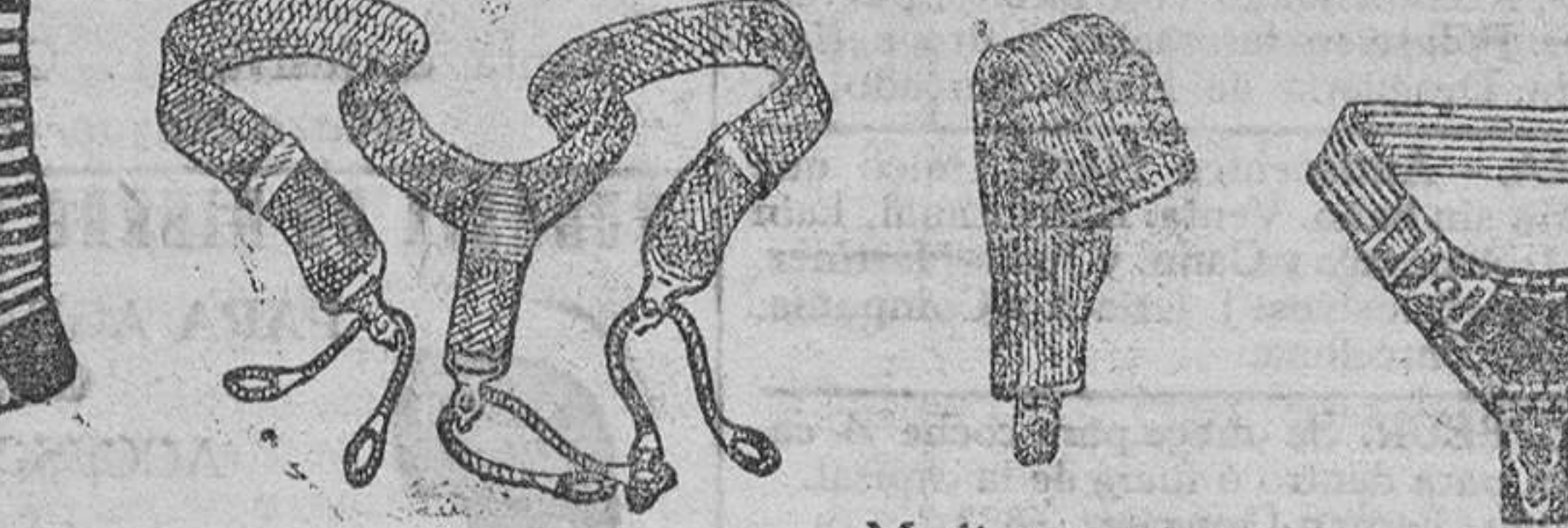
Calcetines ca- Tirantes á 1'25, 1'50, 2'50, 2'50 niños, desde 3'50 Ligas á 0'50, 1, 1'50 ballero á 50 cts. y 3 pesetas á 6 pesetas y 2 pestas