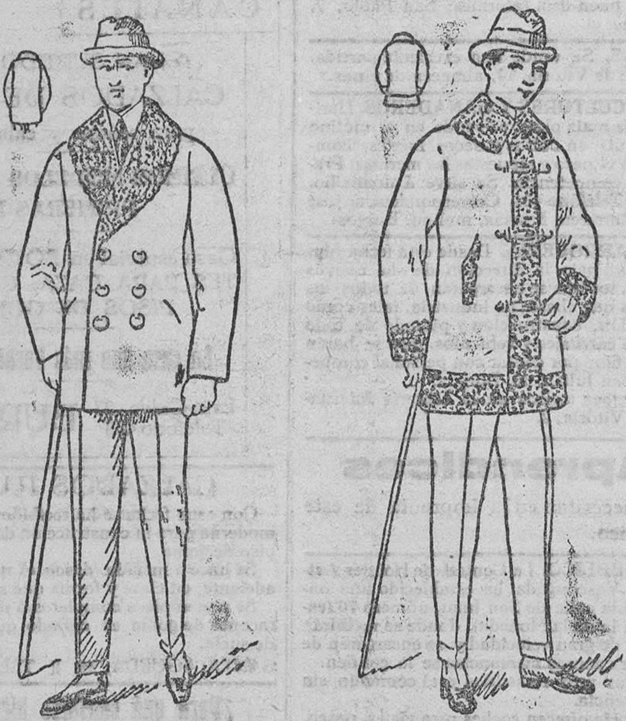
Pelizas paño pluma, rizo al cuello, de 25 á 100 pesetas Pelizas de paño arrasado, cuello y mangas de rizo, desde 30 á 75 pesetas

Gran casa de tejidos, pañería y confecciones de caballero, señora y niños