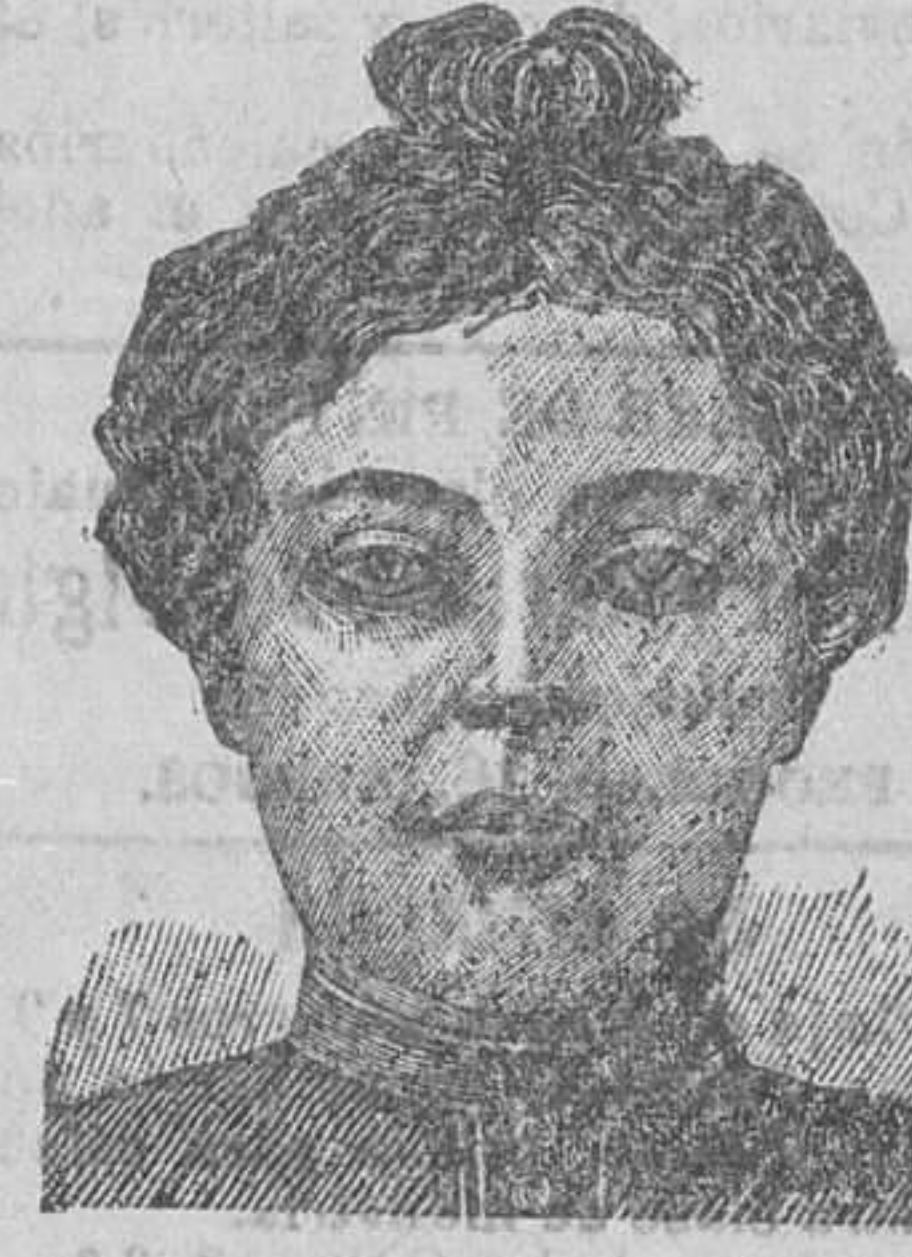
A los 15 días de tratamiento