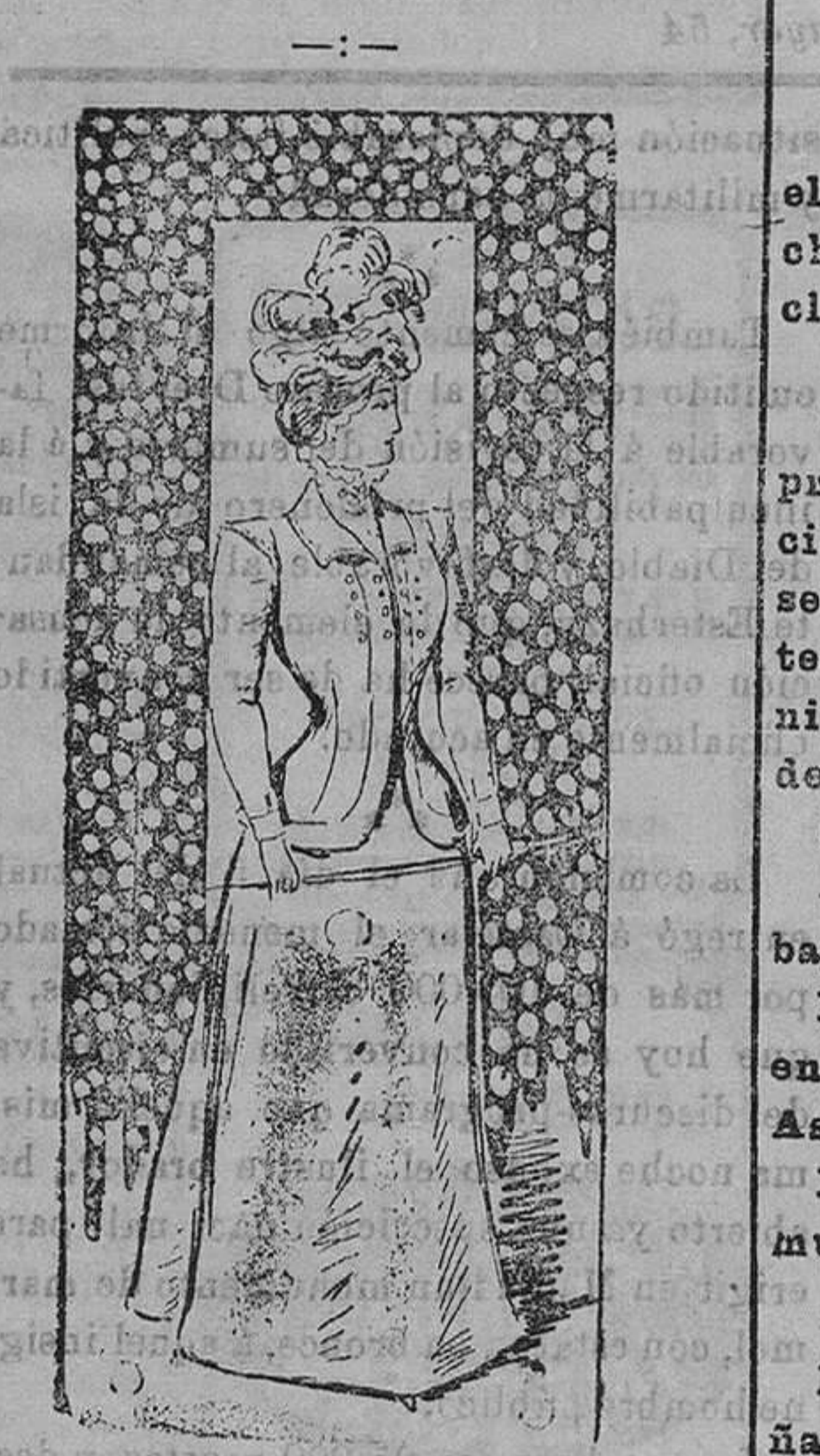
Traje para señora.

El traje que representa nuestro dibujo es de piqué blanco. Consta de una chaqueta compuesta de dos piezas, entallada y con dos hileras de cuatro botones en cada uno de los delanteros. El cuello de esta chaqueta es vuelto y sin otro adorno que un fino pespunte alrededor. Manga estrecha con hombreras y falda lisa acampanada. Nota.—Aquellos de nuestras lectoras que deseen detalles de los modelos de la presente revista, pueden escribir á la sección de confecciones de los Grandes Almacenes de EL SIGLO, Barcelona, y recibirán gratis inmediata contestación.